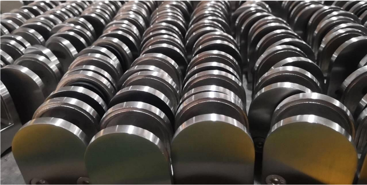
3) Projektfotos von Glasklammern für Glasgeländer -