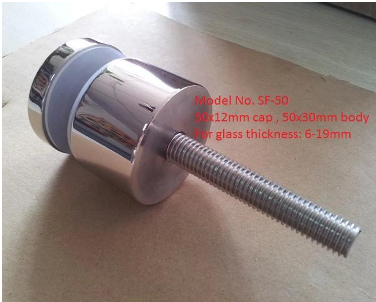
Modell No.SF-50T Glas Patt