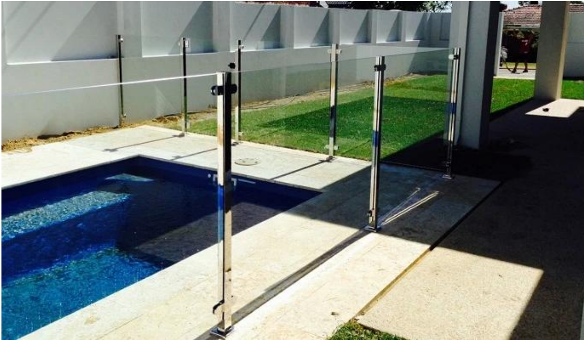
Deck, Balkon Edelstahlpfosten & Handlauf Glas Geländerrahmen Projekt: