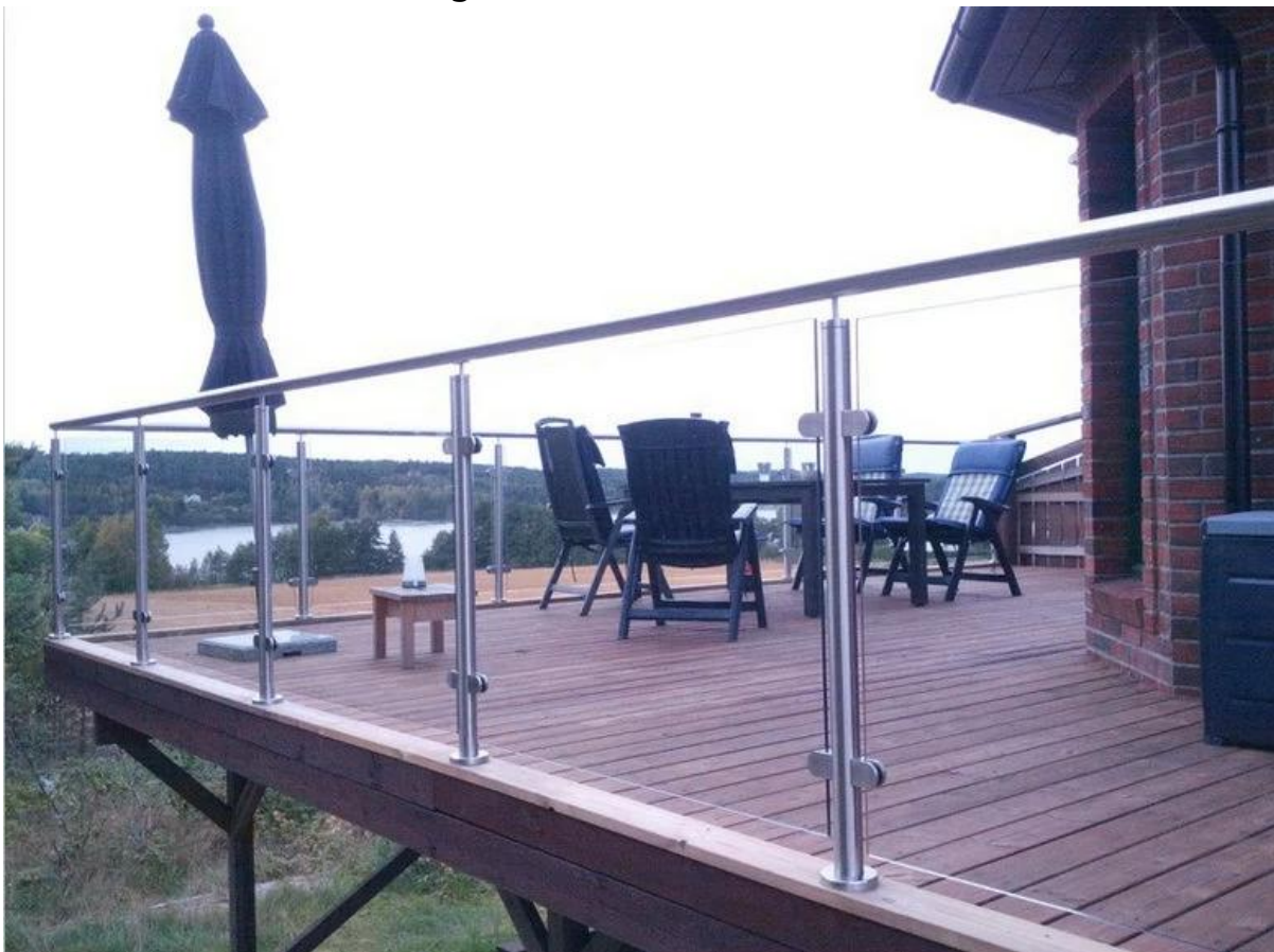
Pool Fechten Design