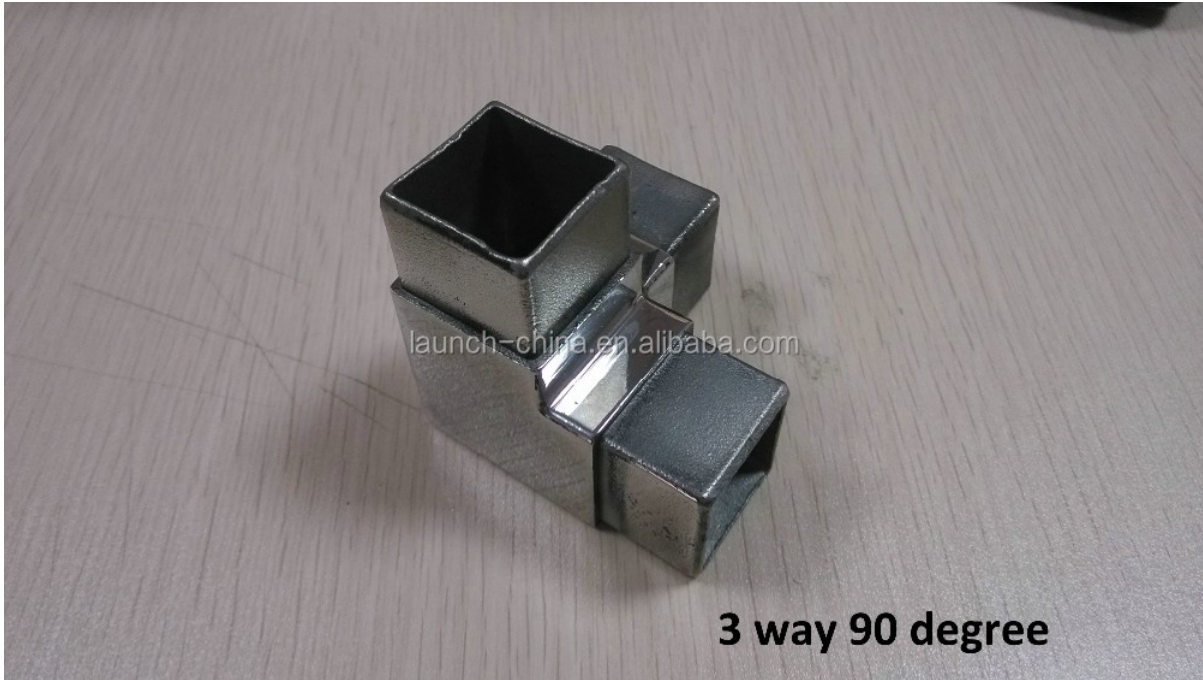
3 way 90 degree