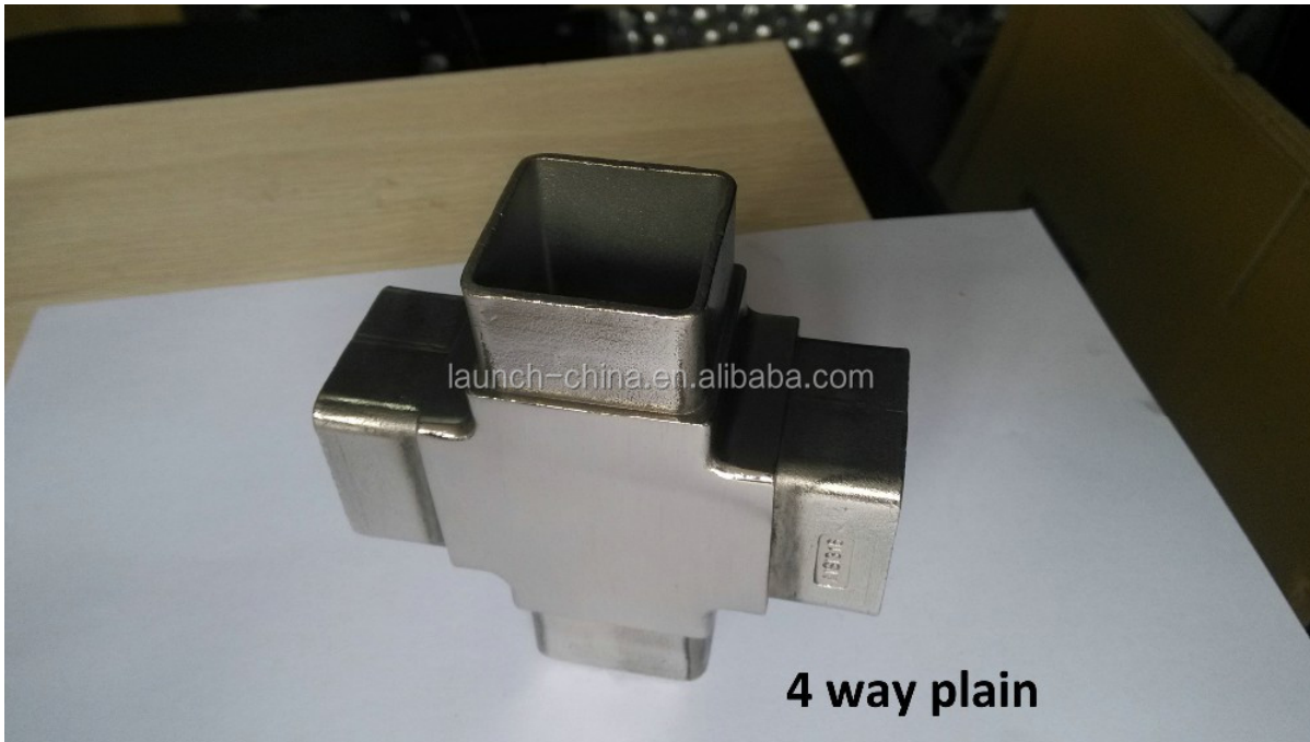
6. Modell No.E301 Edelstahl-Anschluss für Rohrdurchmesser 42.4mm / 50.8mm