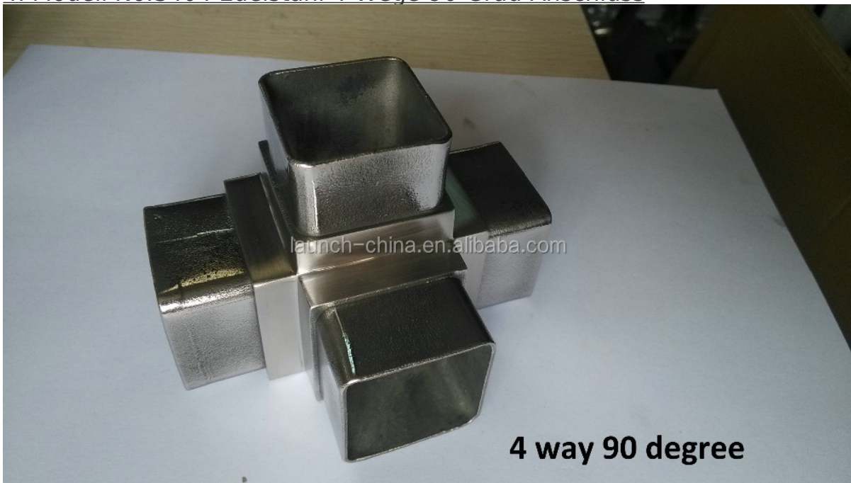
4 way 90 degree