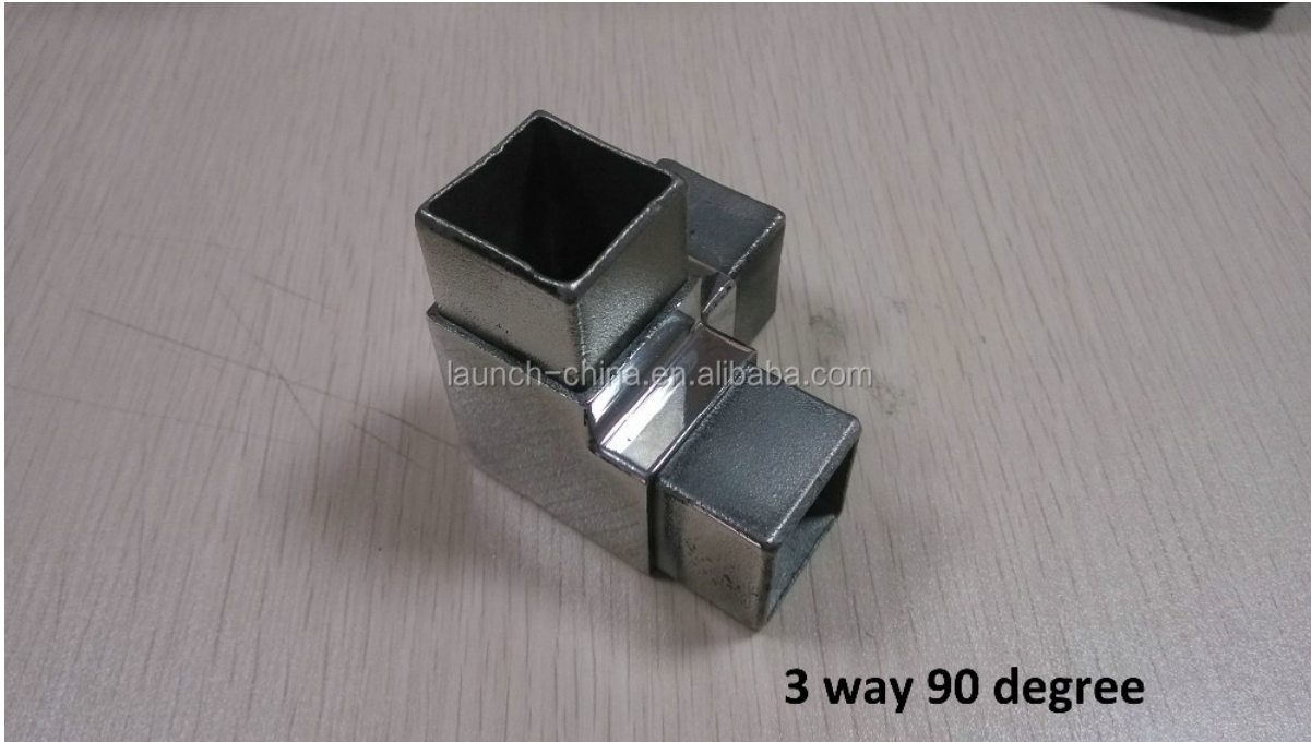
3 way 90 degree