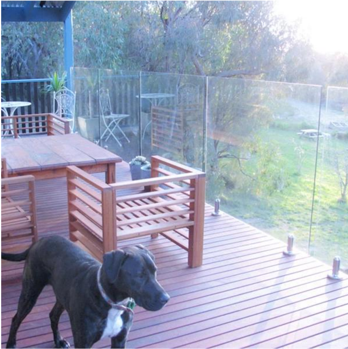
Rahmenlosen Glas Balkon mit Abstandshalter: