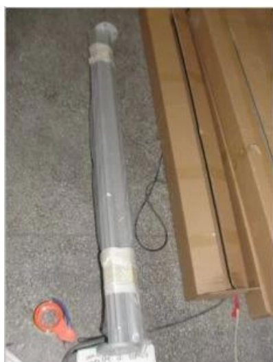
1. plastic bag/bubble bag

Se puede embalar como requisito del cliente.