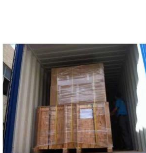
3. Full packaging