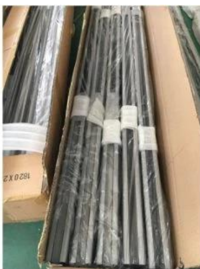
2. 2-5 pieces into one box