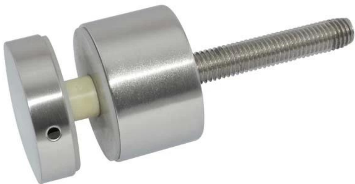
Foto de montaje madera soporte separador de cristal