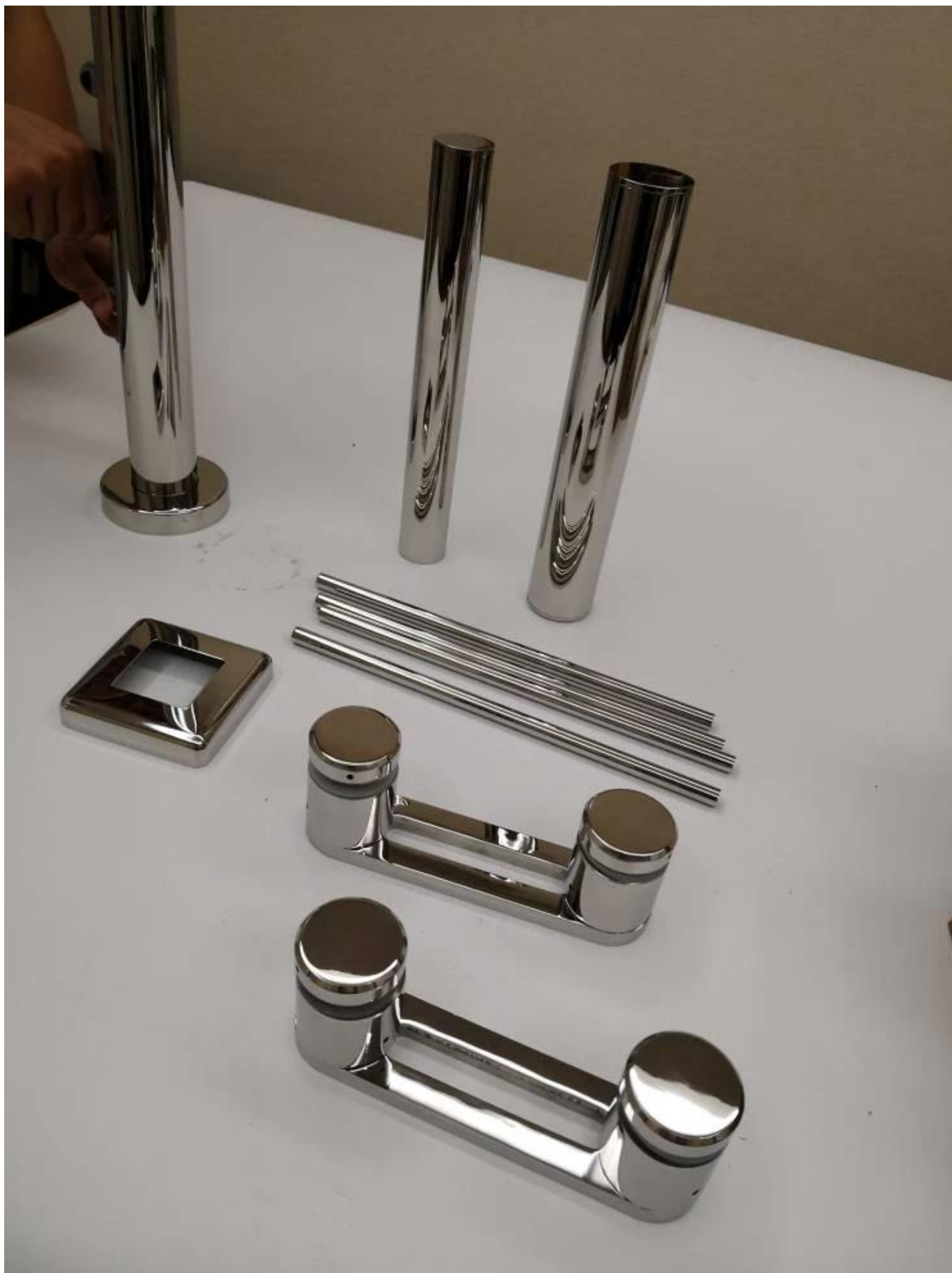
Fotos de producción para el perno de separación