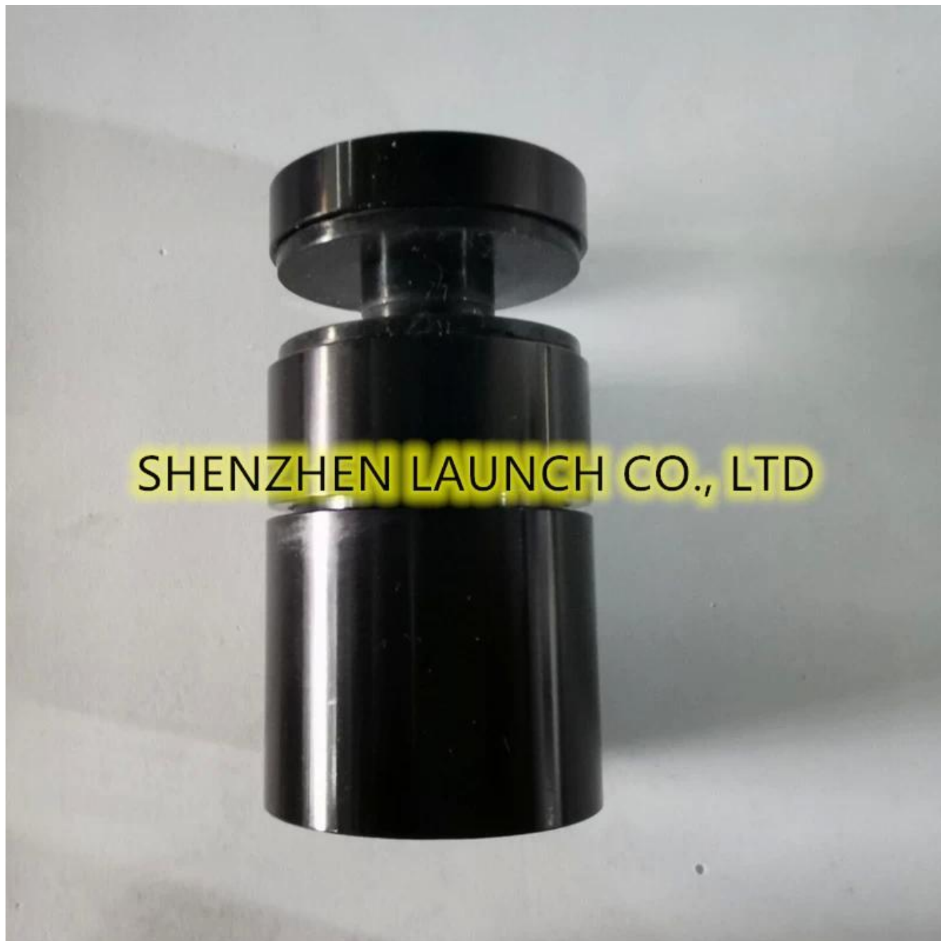
Acabado mecanizado del perno separador -