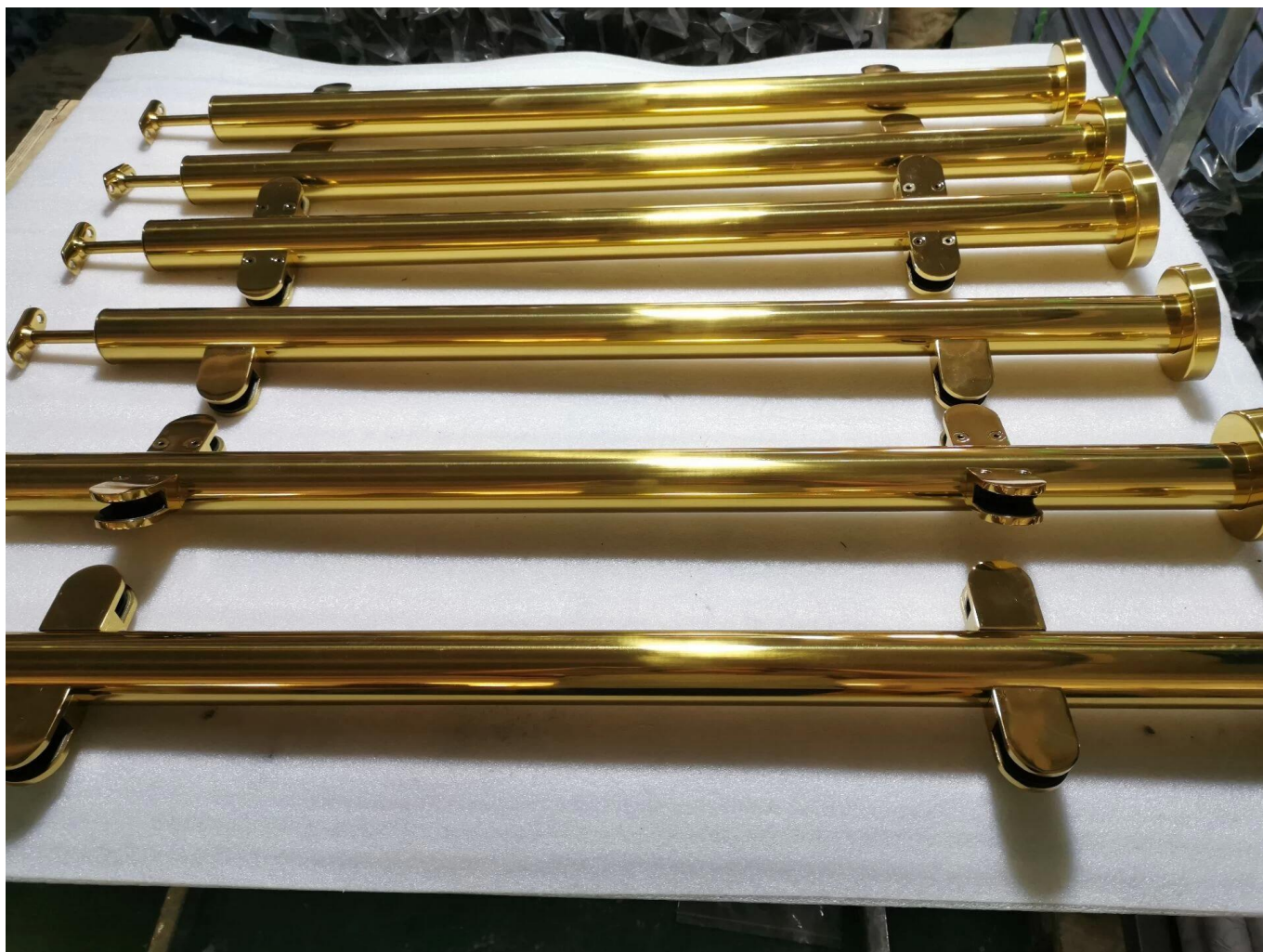
Redondo Pasamanos Tubo: