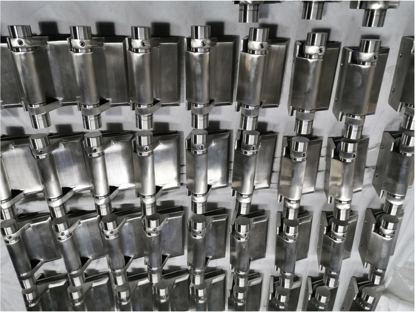
Vidrio ho; E Dibujo requerido -