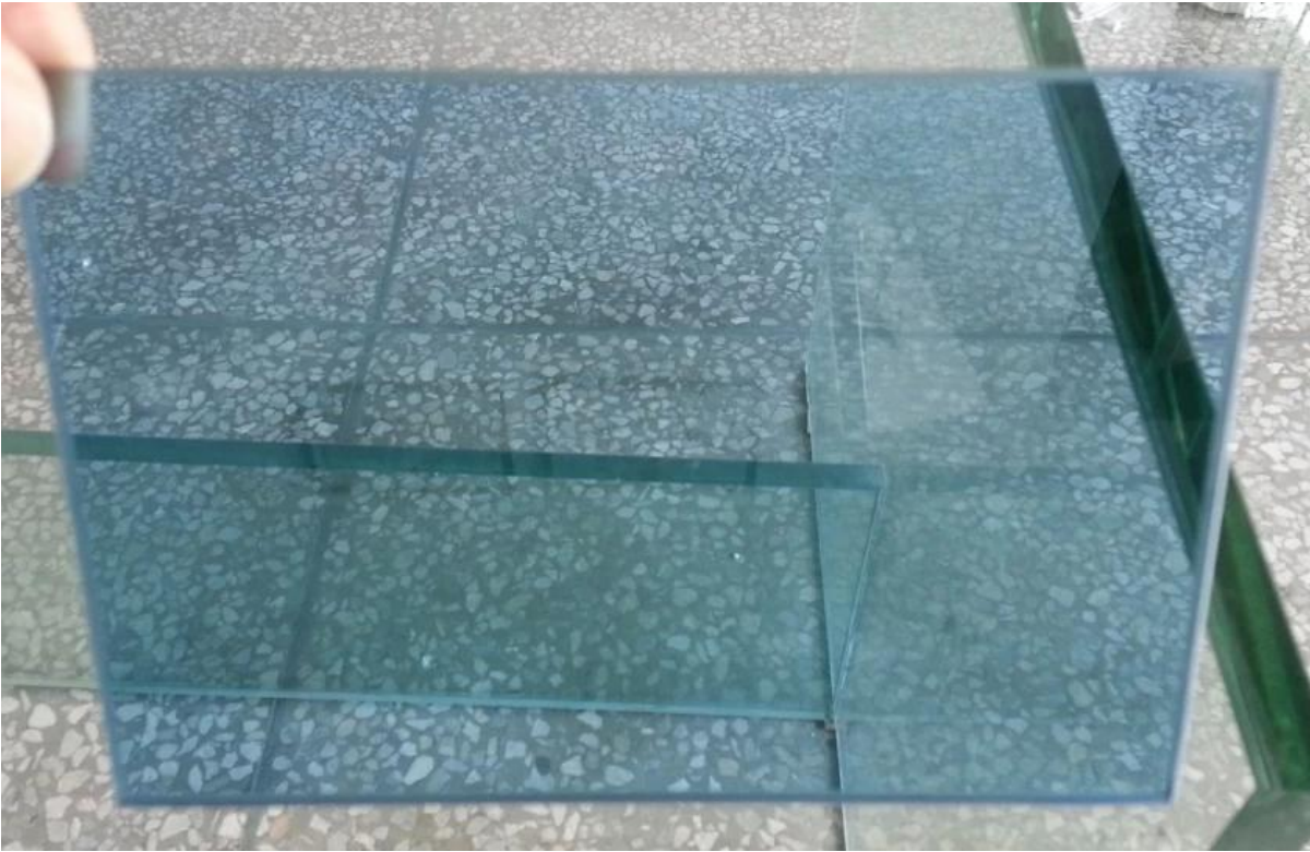
ultra claro templado vaso