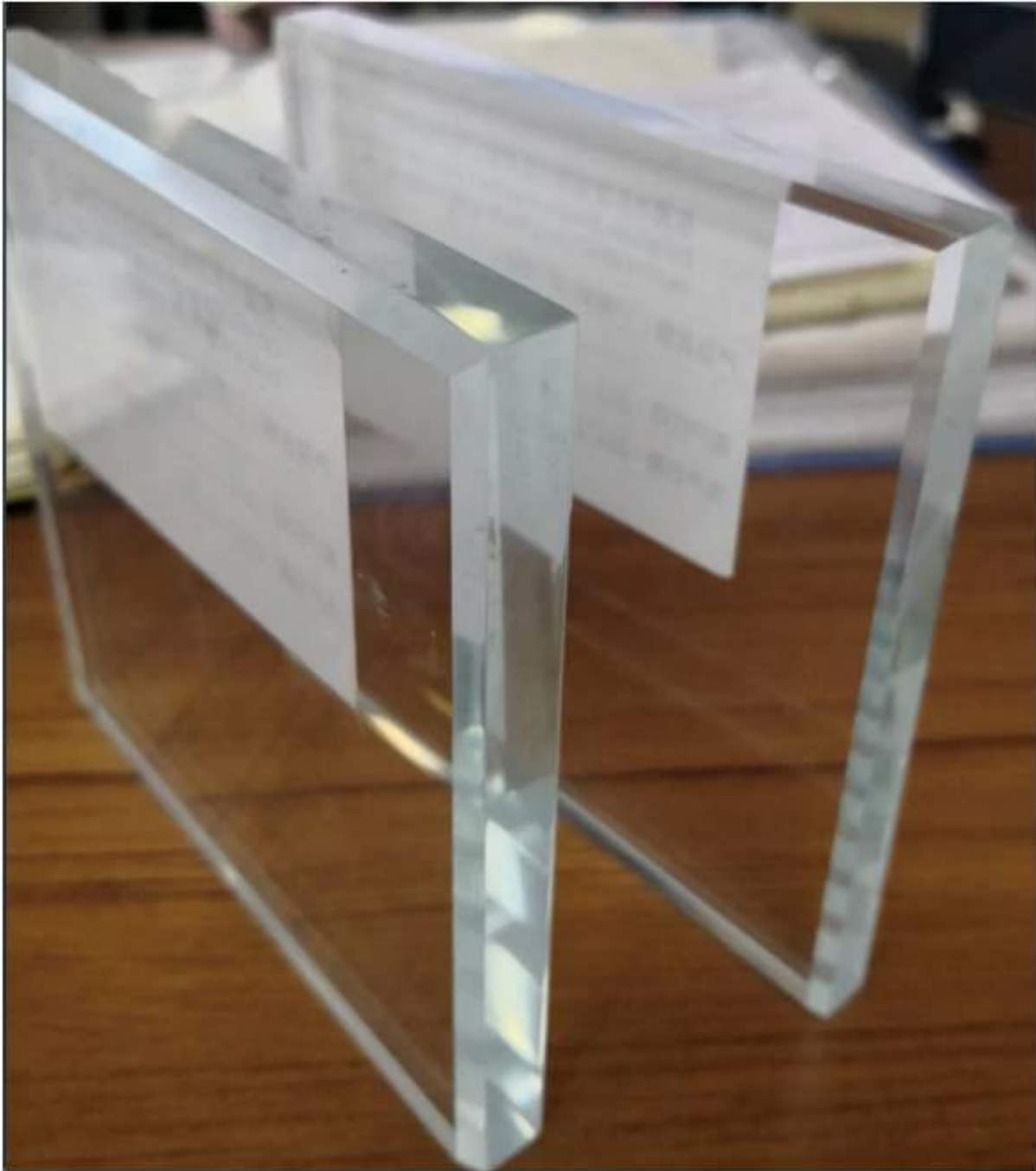
Fotos de proyecto de barandilla de cubierta de vidrio -