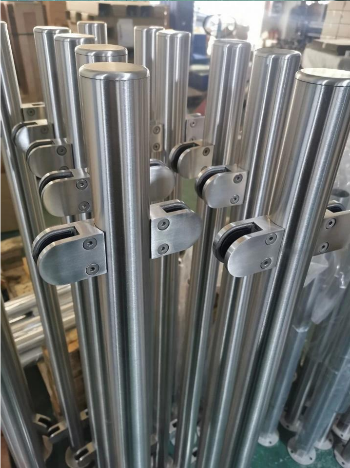
Tubo de barandilla redonda: