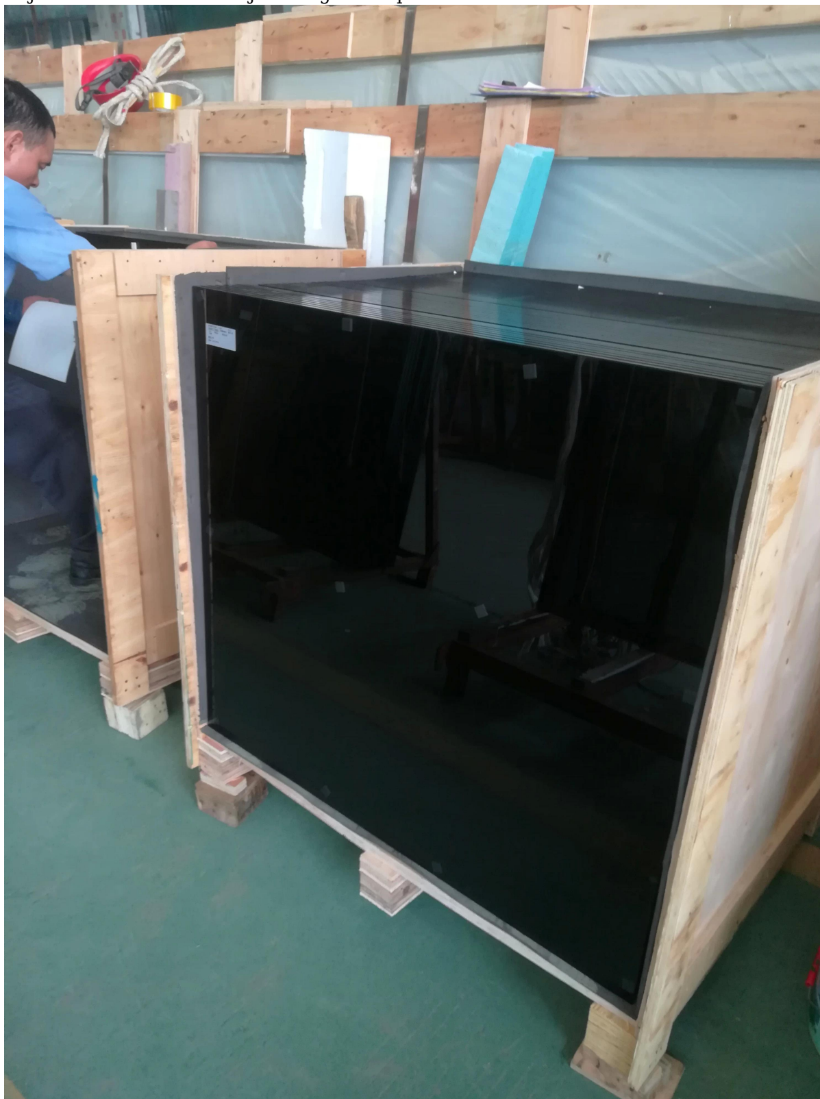
Caja de madera de embalaje de seguridad para el envío