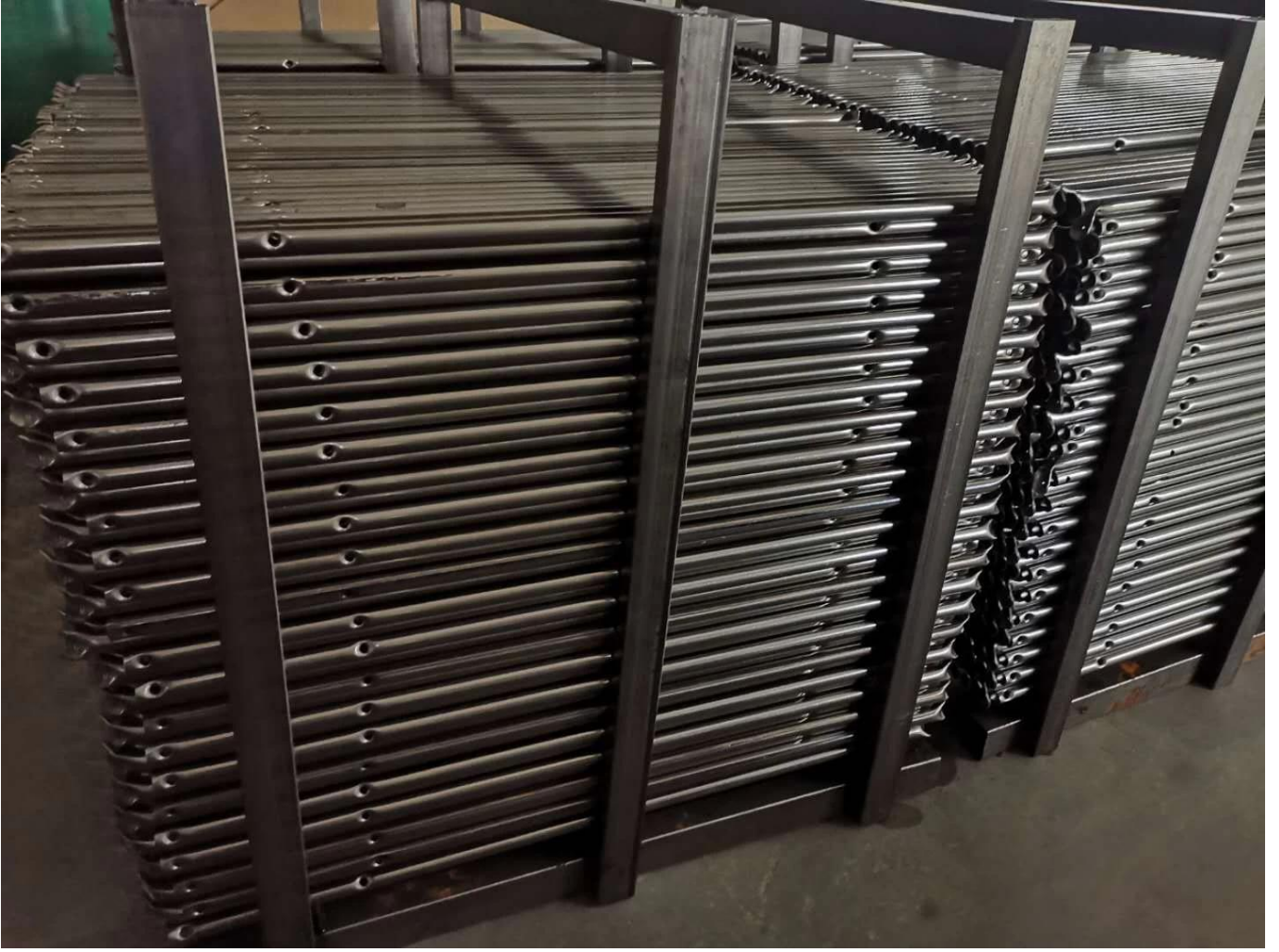
Embalaje de fotografías