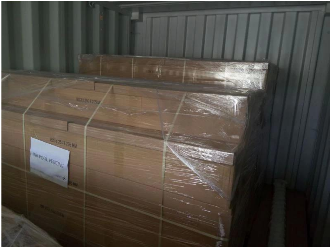
Imagen del proyecto, aplicación más utilizada como cercas de piscinas, sistemas de barandillas de balcones, sistemas de barandillas de cubiertas