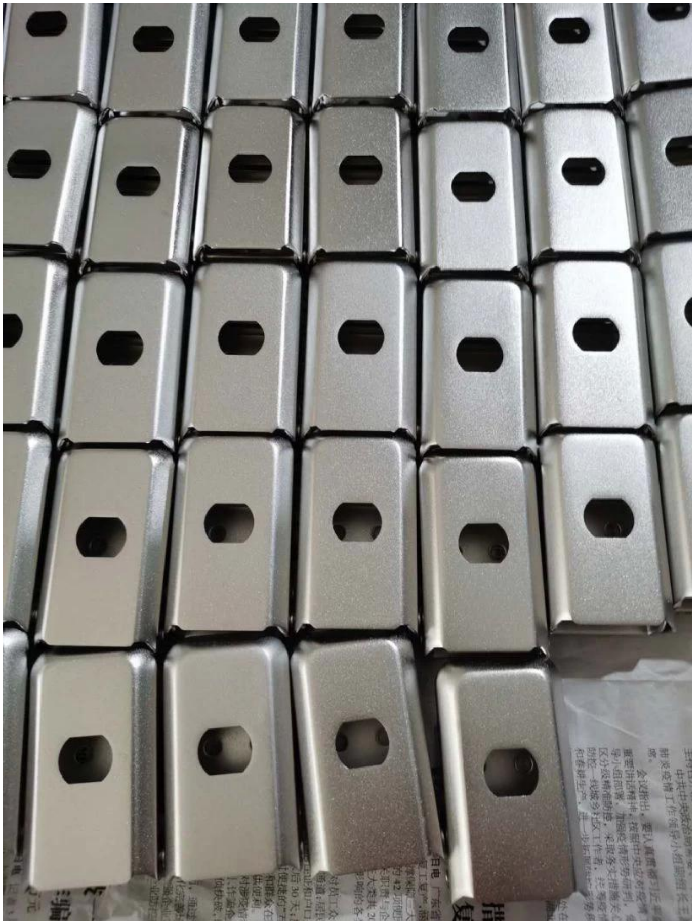
Otros productos OEM