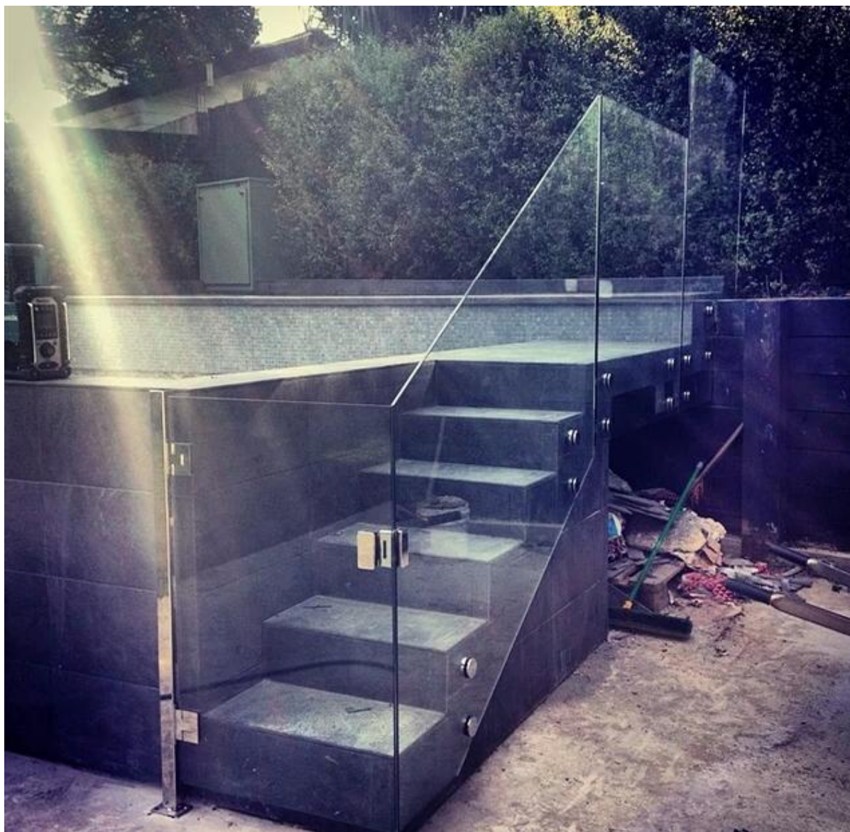
china de acero inoxidable enfrentamiento cristal de la terraza de barandilla de cristal sin marco, enfrentamiento vidrio escalera de acero inoxidable para cubiertas de madera