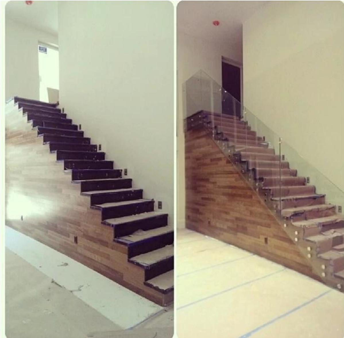
Hardware de montaje en pared barandilla de vidrio, separador de cristal para el balcón al aire libre, soporte de enfrentamiento de la escalera interior