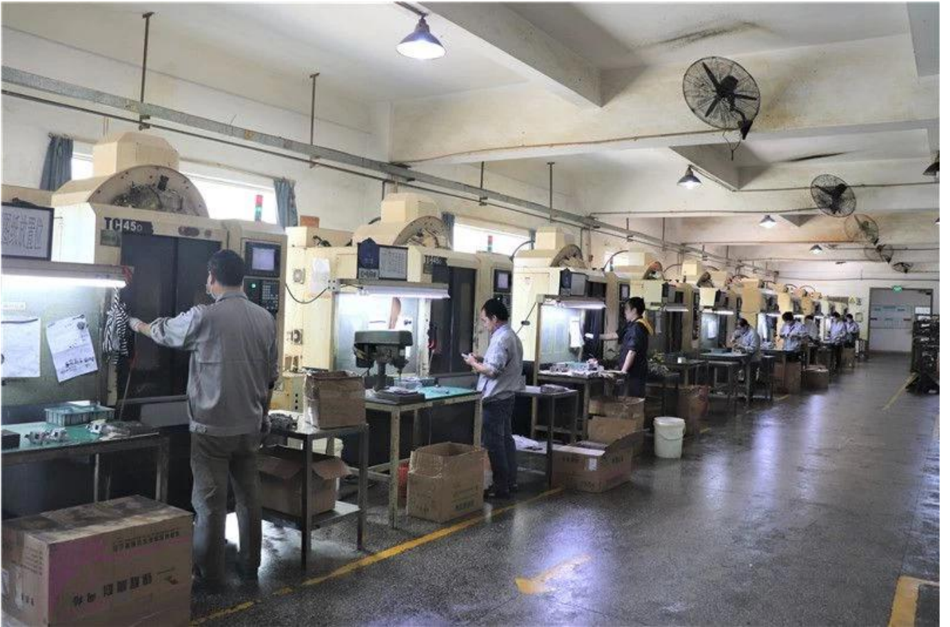
Maquina de estampado