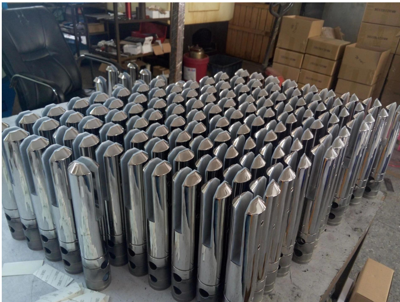
Fotos del proyecto de la escuadra de la espiga de perforación de núcleo-