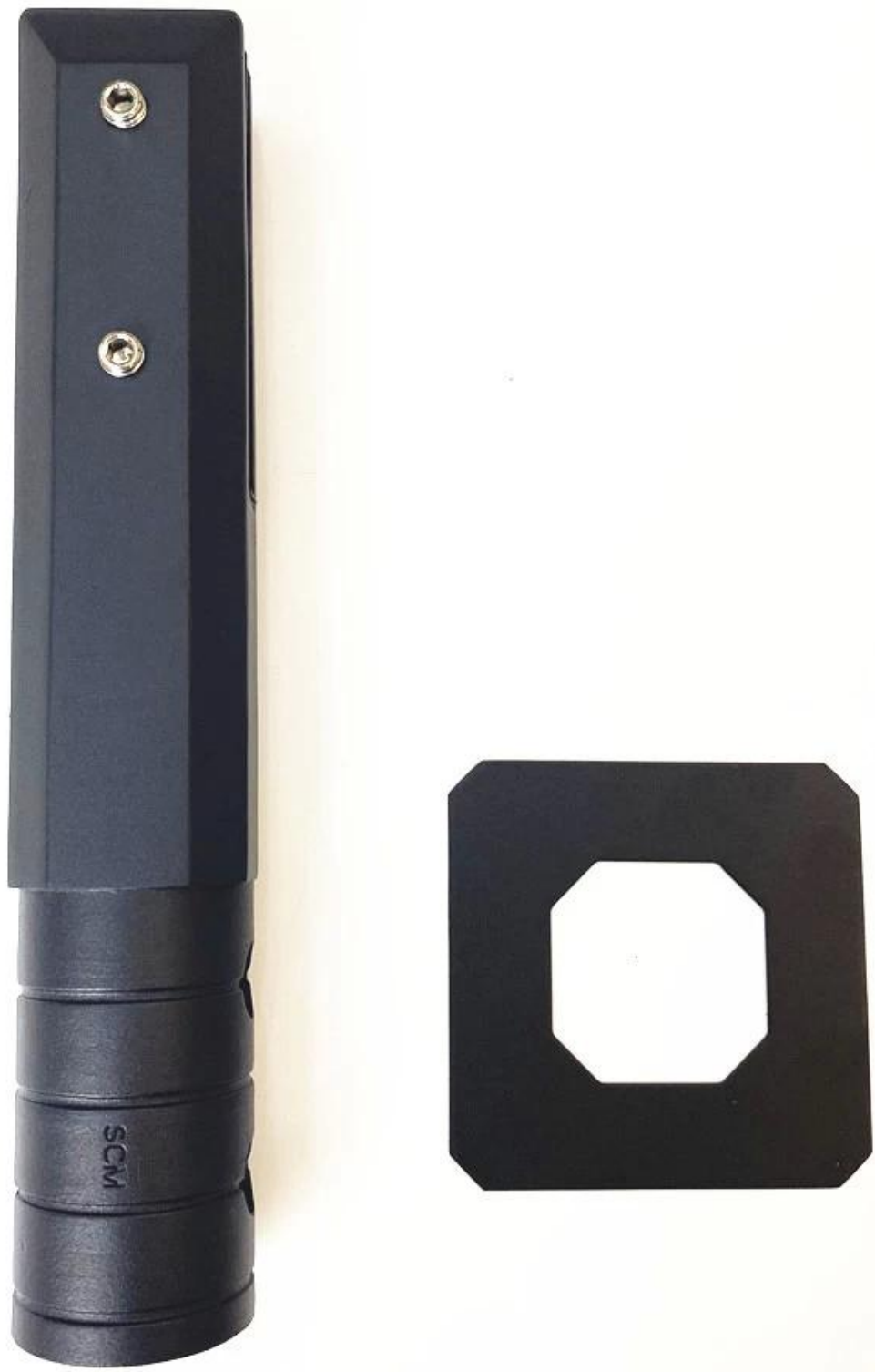
Espiga de perforación de núcleo redonda y cuadrada -