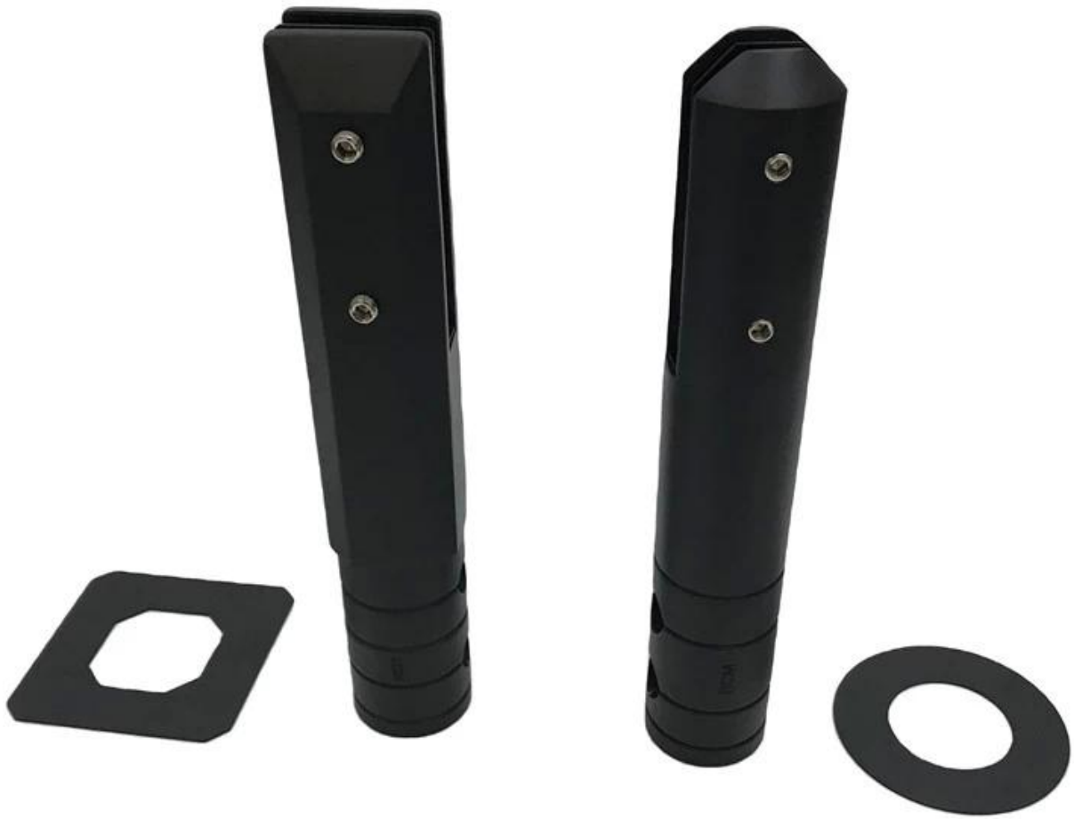
Dimensiones de la espita de vidrio de perforación de núcleo SCM