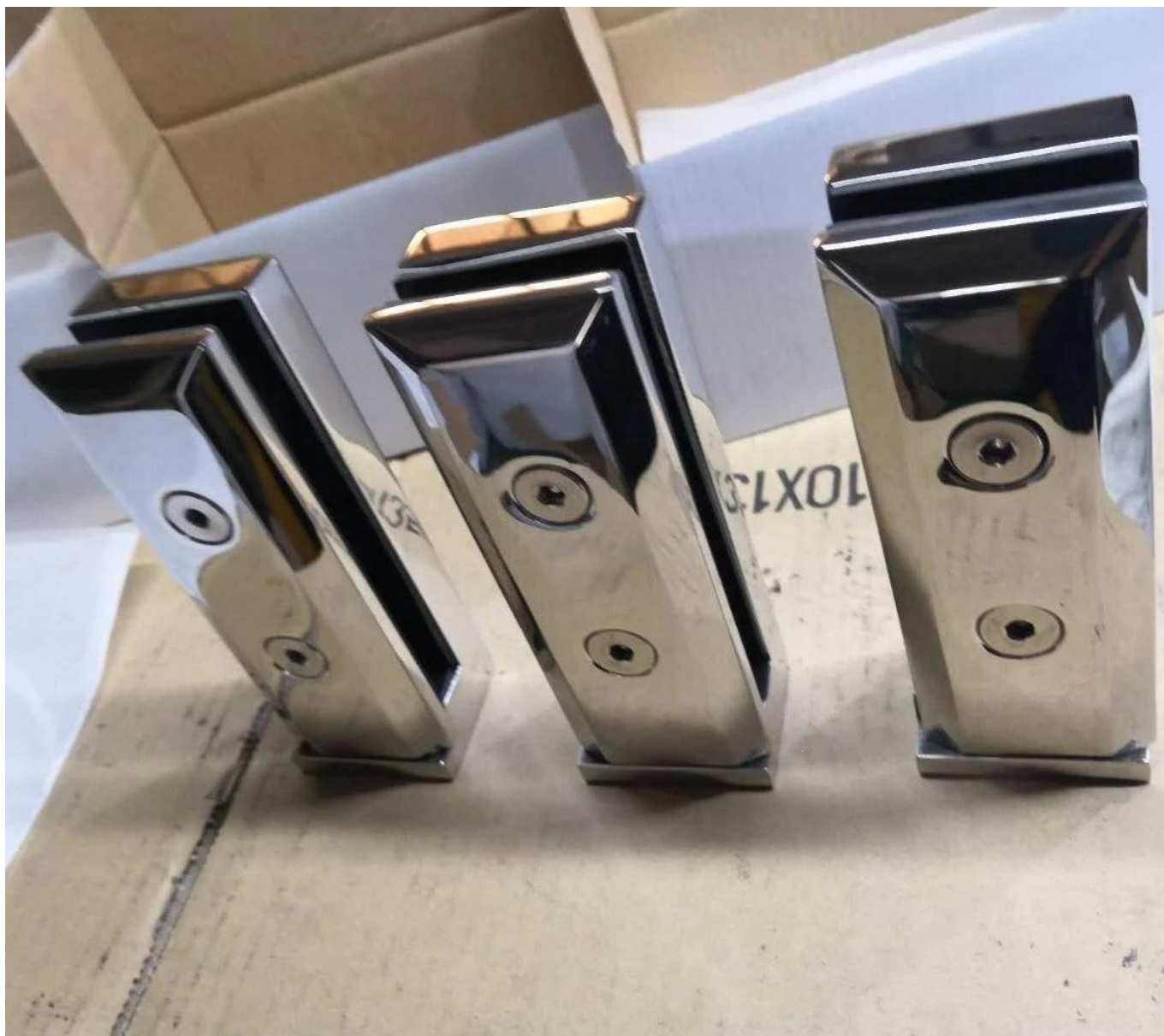
2) Tamaño de la espita de vidrio de montaje lateral