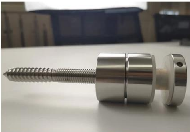
Otros modelos de separadores de vidrio como abajo-