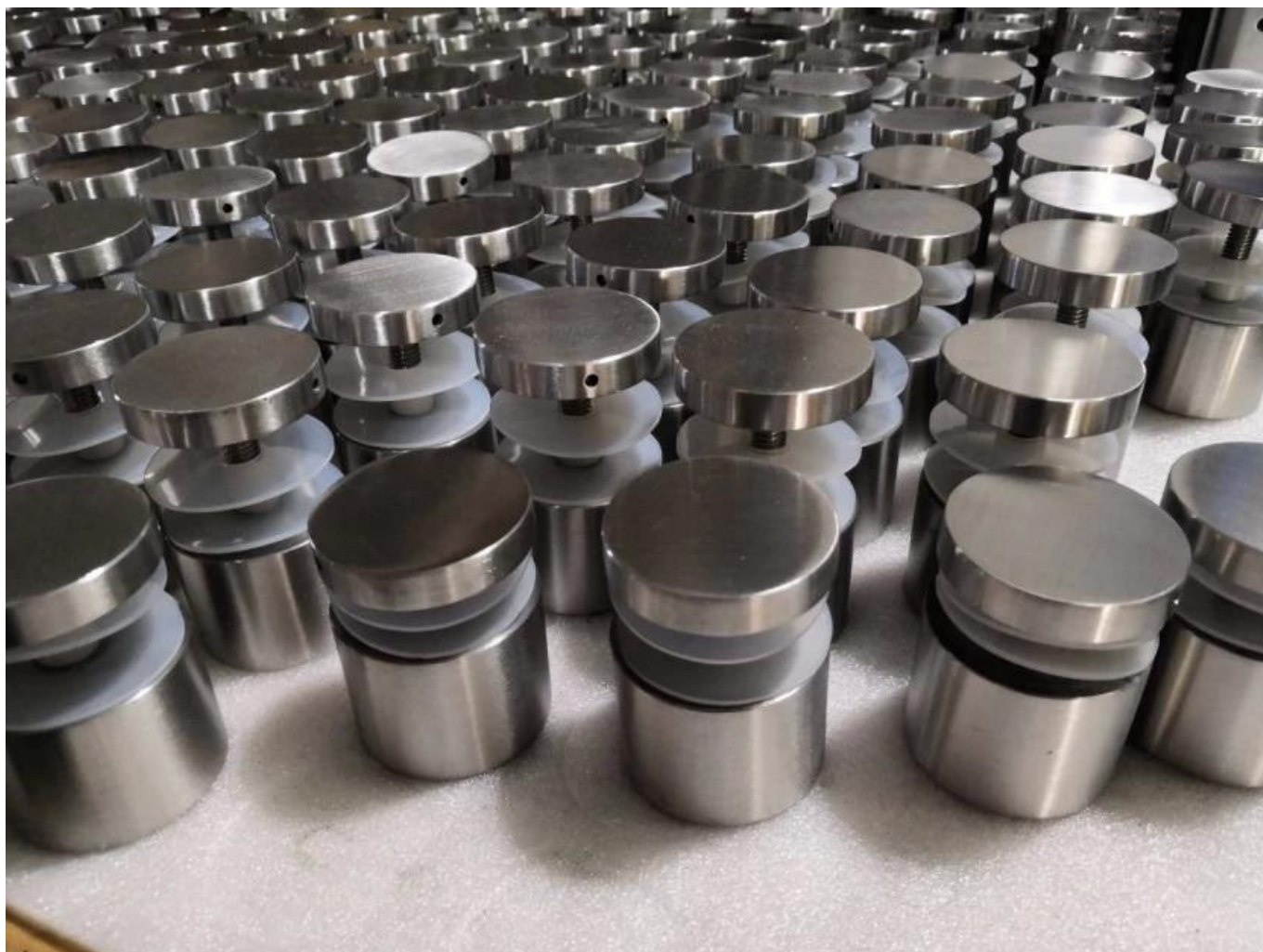
Fotos de instalación de barandillas de separación de vidrio