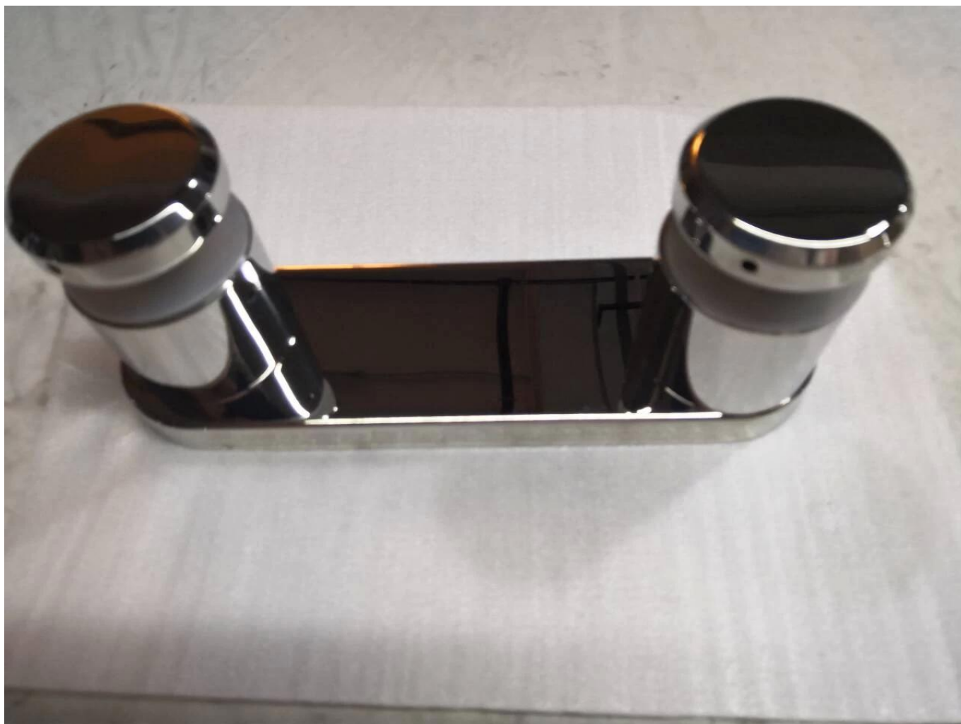
Adaptador de separación de vidrio de alta resistencia para usar con barandilla de panel de vidrio de 15 mm de espesor