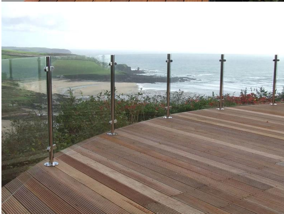
Paquete de seguridad del poste de la barandilla: