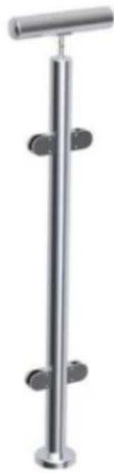
2-way 180° post