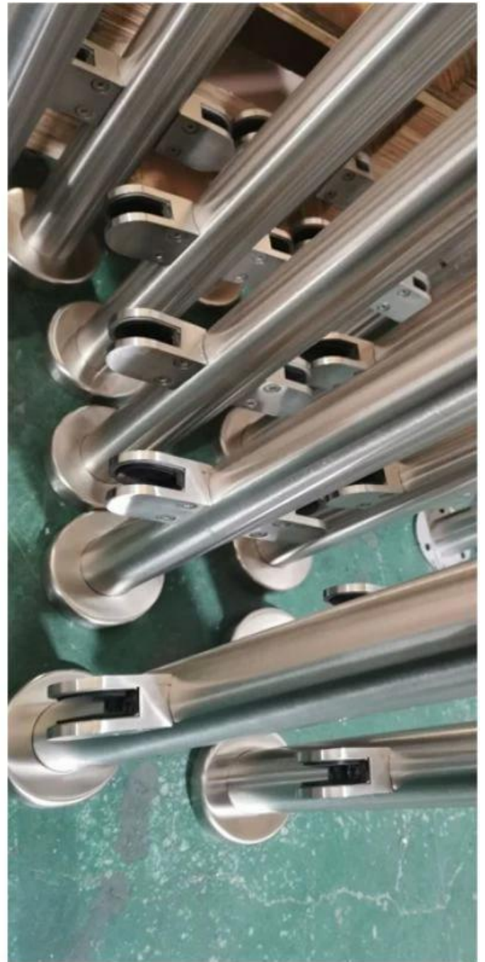
PAGOST con la barandilla superior