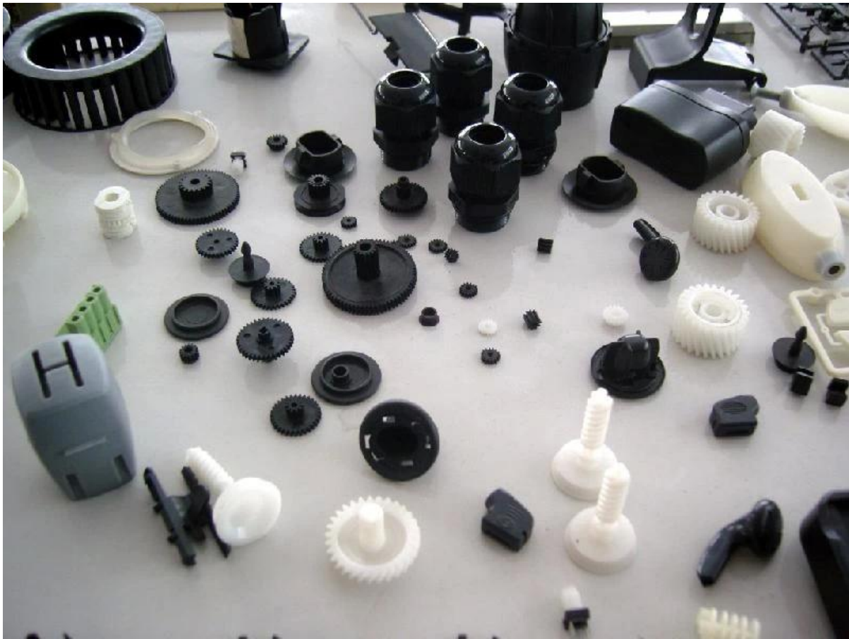
Fábrica y equilibrio