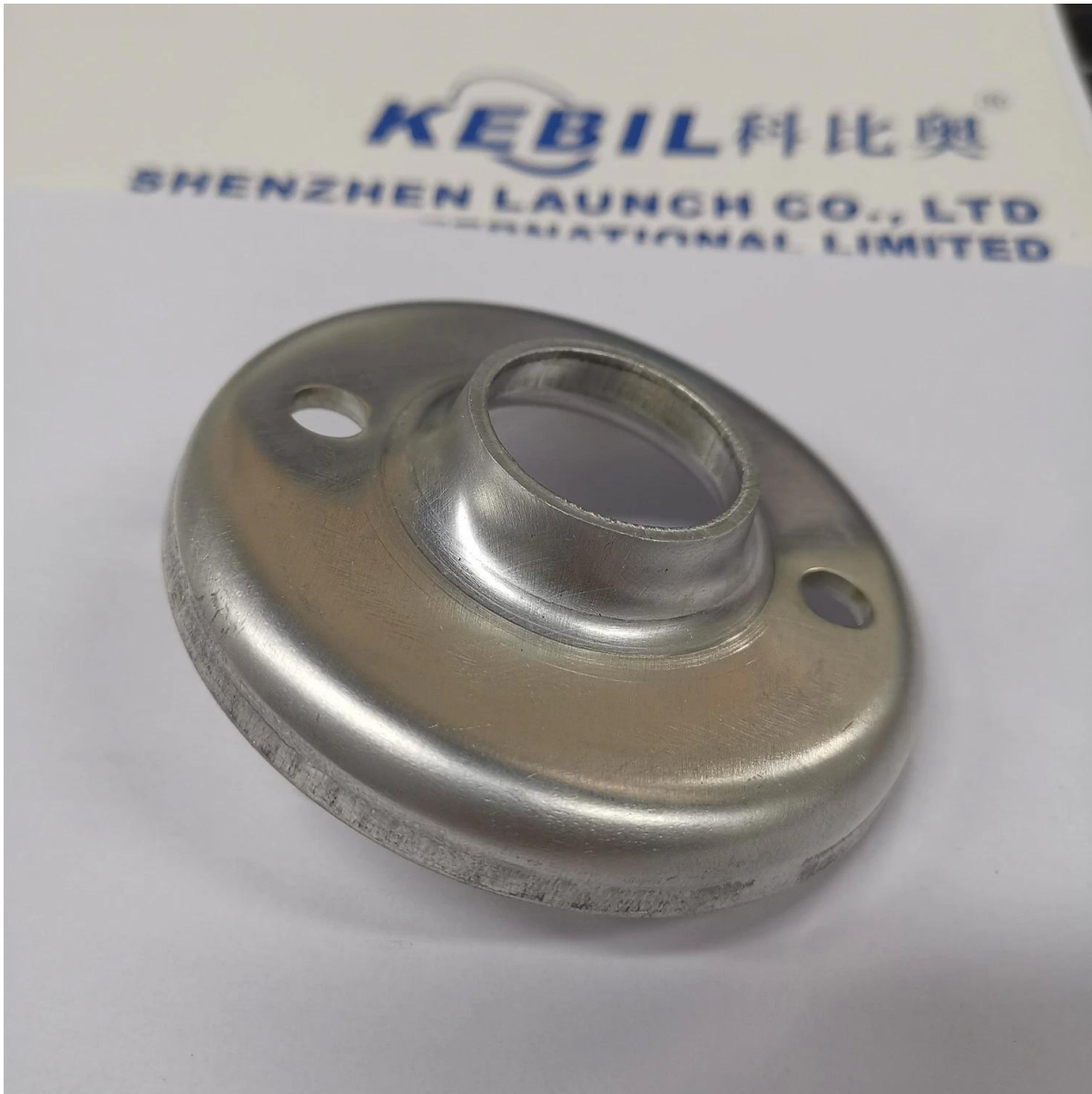
Estampado de piezas de repuesto OEM personalizadas