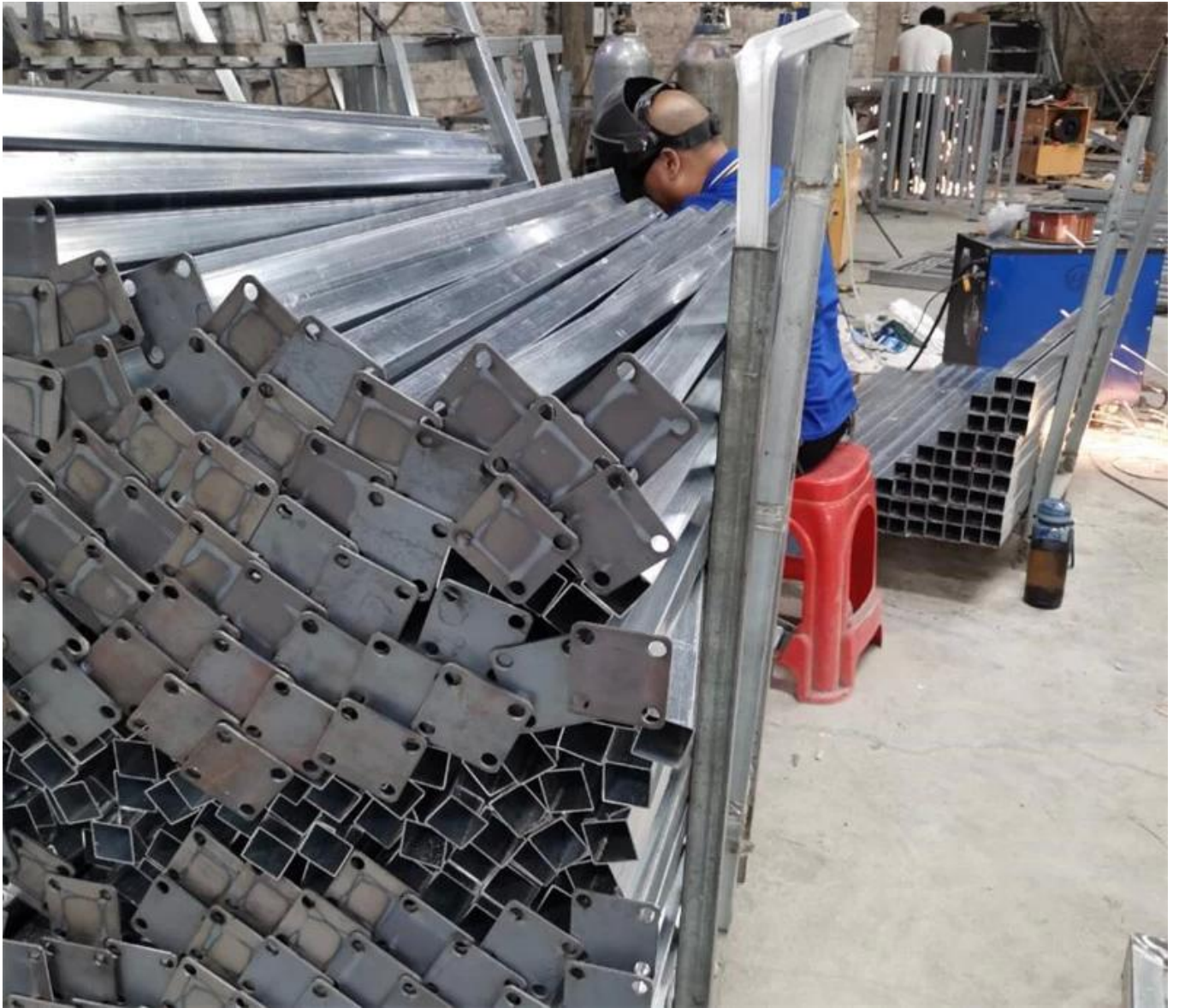
# Fotografías de proyectos de barandillas de acero -