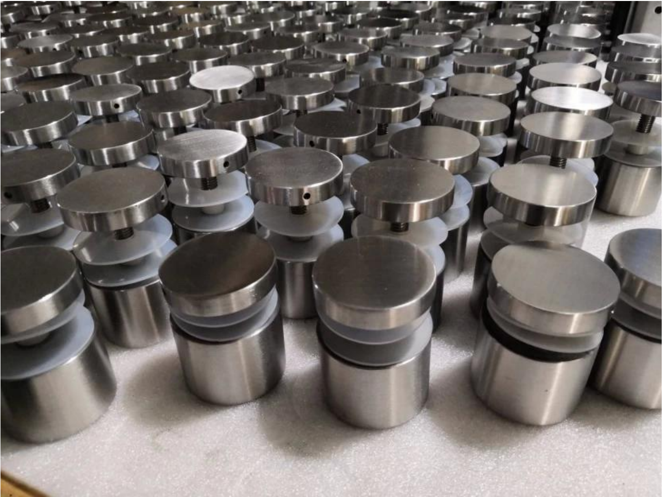
Fotografías de instalación de las barandas de vidrio.