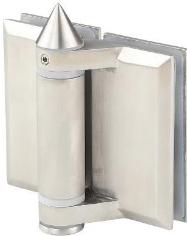
Modelo No. G-W2, bisagra de cristal a post / pared cuadrada