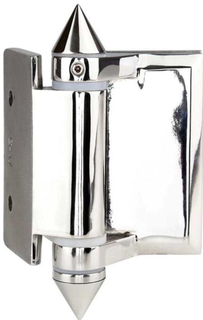
Modelo No. G-R, vidrio a poste cuadrado / bisagra de pared