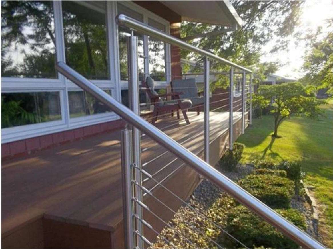
wire rope railing system