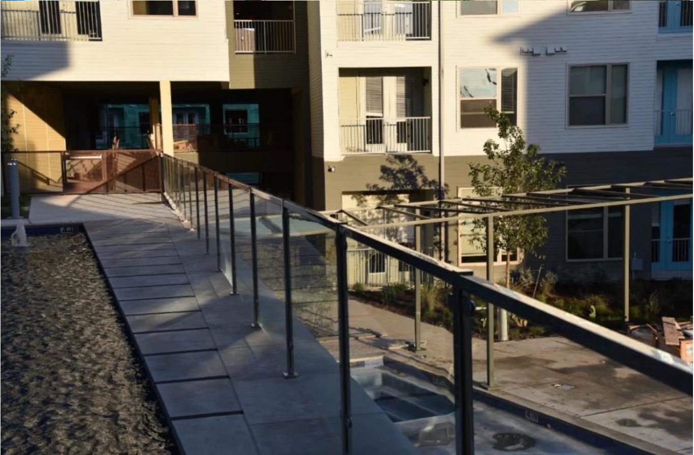
Redondo diseño enviar para nadando piscina pretil: