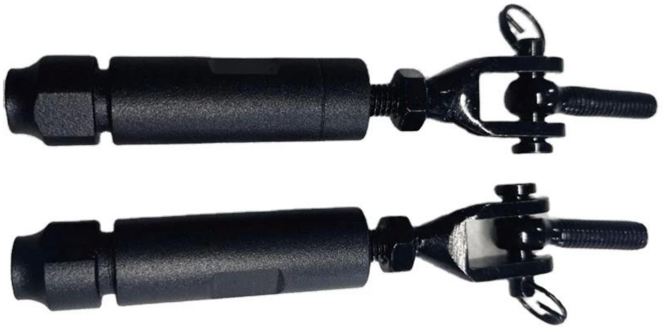
Fotos del proyecto de barandilla de cable de acero inoxidable-