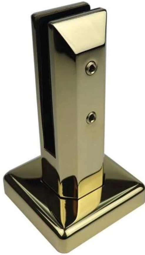
Negro pulido Cerca de acero inoxidable Abrazadera de vidrio Piscina cerca Spigot RBM: