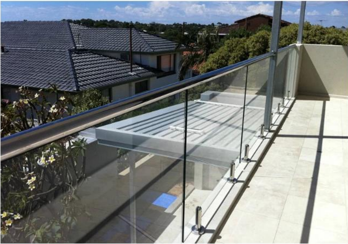
2. acero Sainless Espita para el diseño de la piscina: