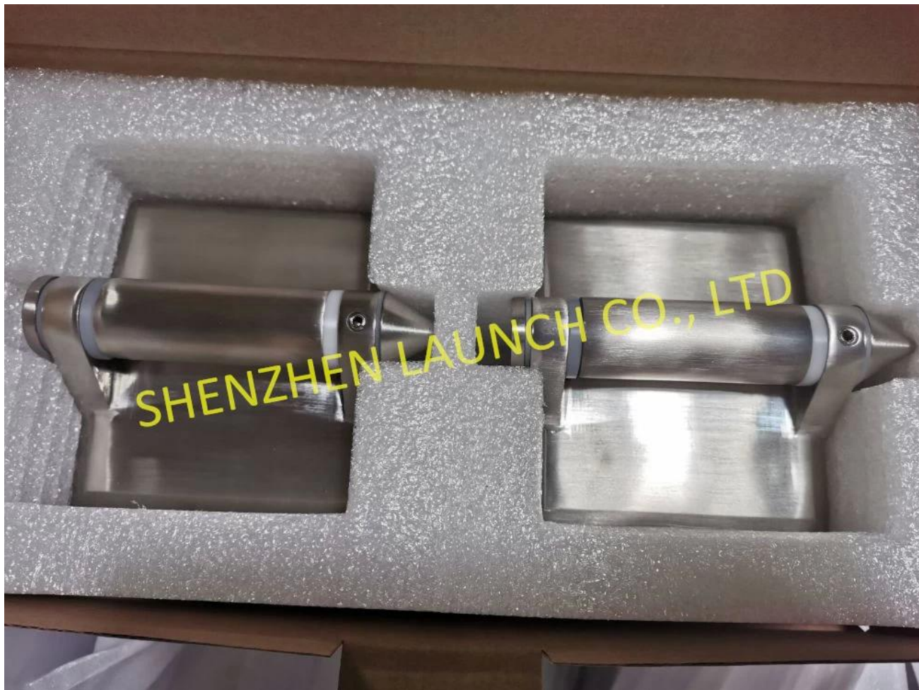
Vidrio a la bisagra postal de cristal, Con tapa plana en los extremos.