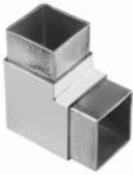
2-way tube connector

For tube dimensions Model 40×20×1.5(mm) S400 40×40×1.5(mm) S401 50×50×1.5(mm) S501 51×51×3.2(mm) S511 50×50×3.0(mm) S511A