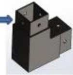
3-way tube connector

For tube dimensions Model 40×20×1.5(mm) S400 40×40×1.5(mm) S401 50×50×1.5(mm) S501 51×51×3.2(mm) S511 50×50×3.0(mm) S511A