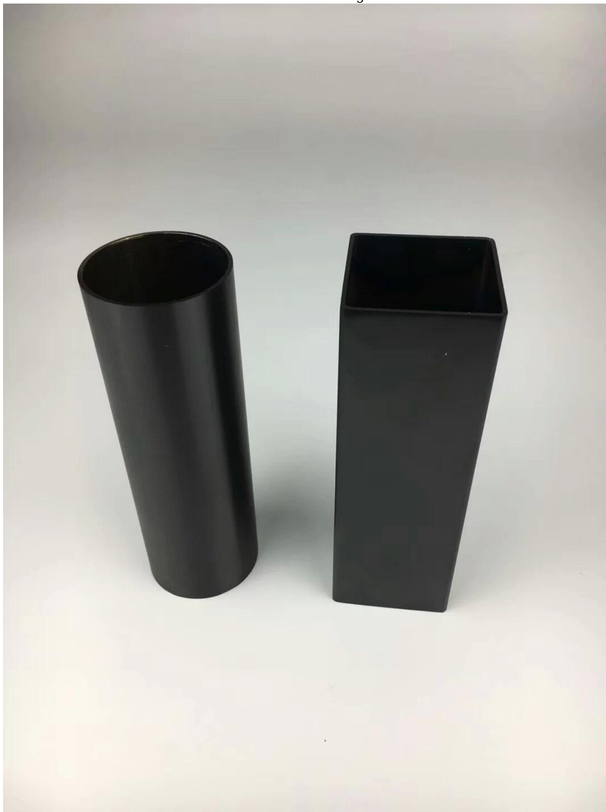
Tubo de tubo de balastrada de acero inoxidable de oro electrochlate