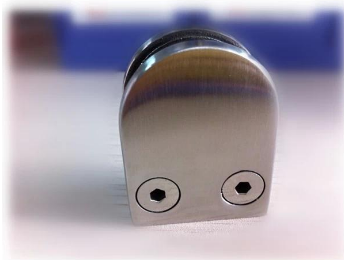
G104 glass clamp, flat