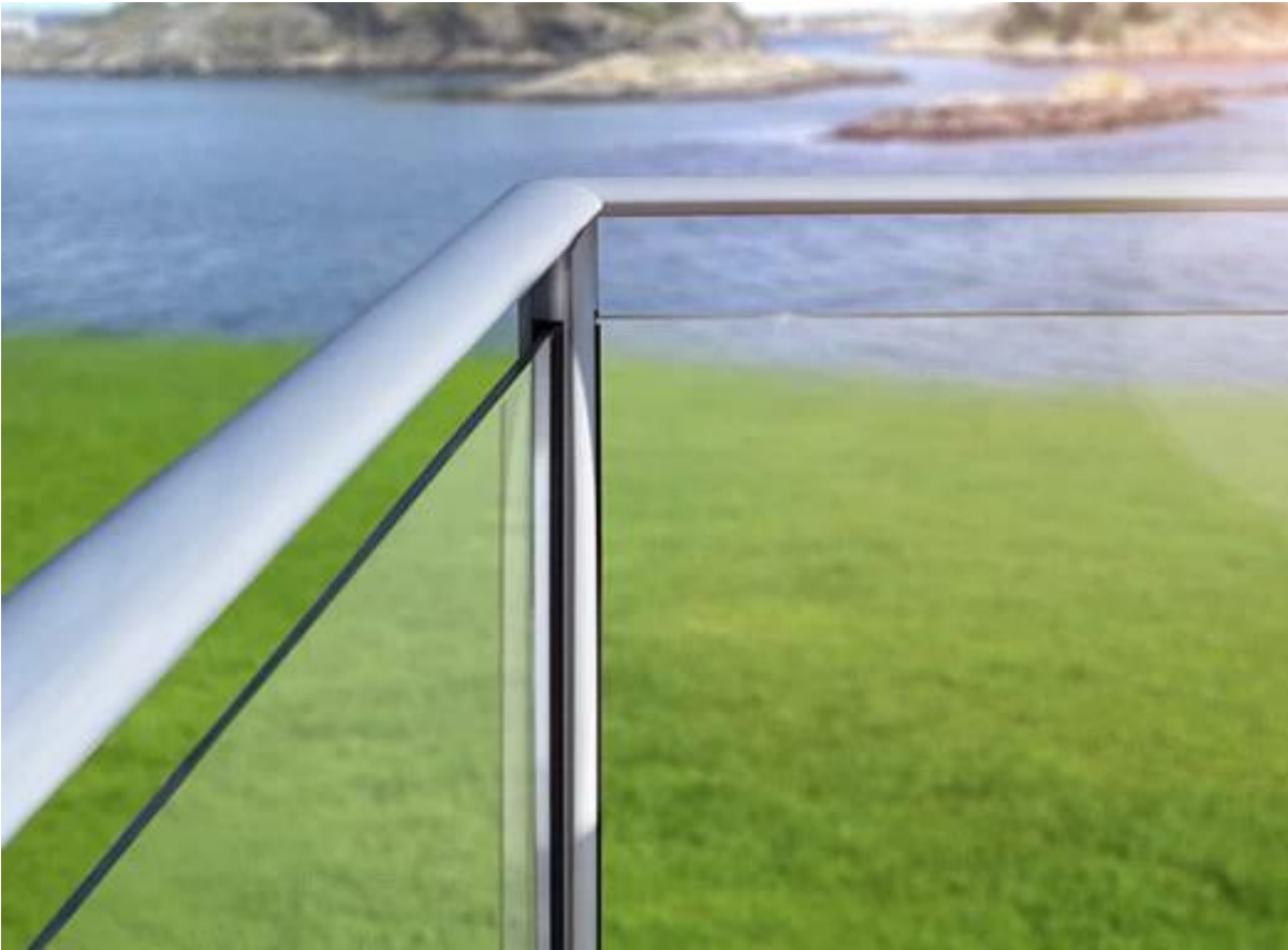
Sistemas balcón de vidrio de acero inoxidable: balcón barandilla diseño 1200mm alto para edificio residencial