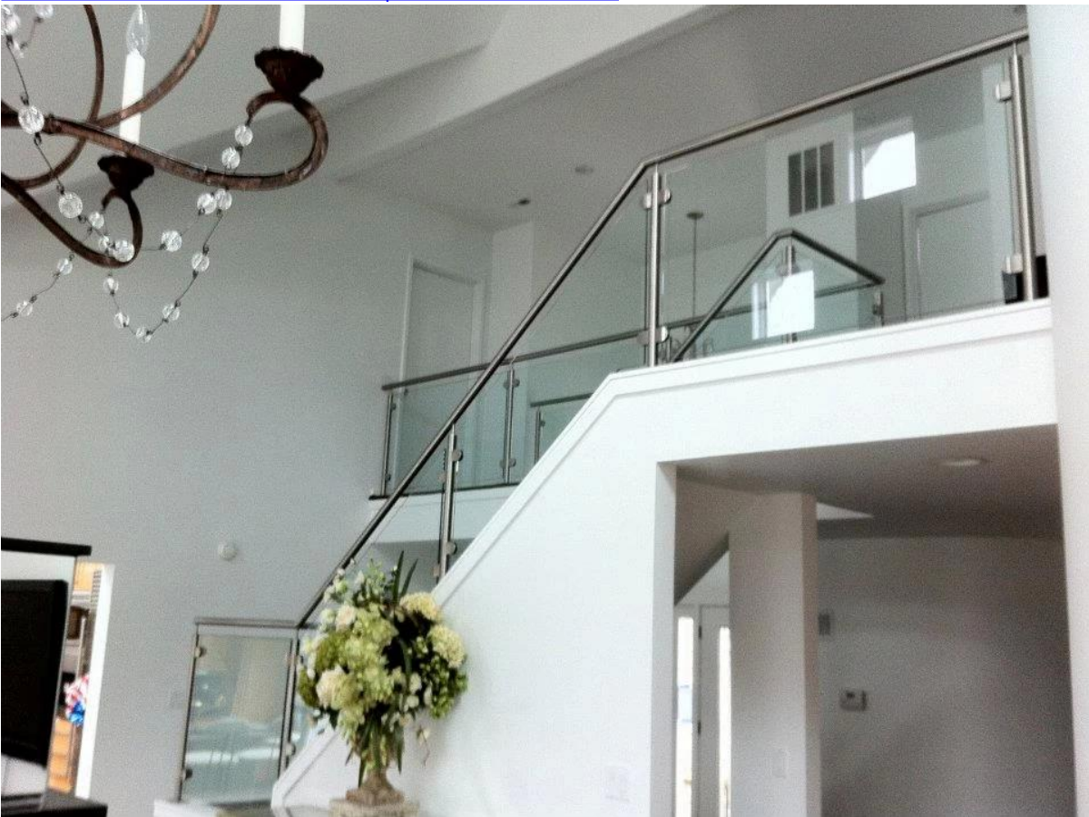
12mm barandilla de vidrio con grifo de vidrio para el diseño balcón