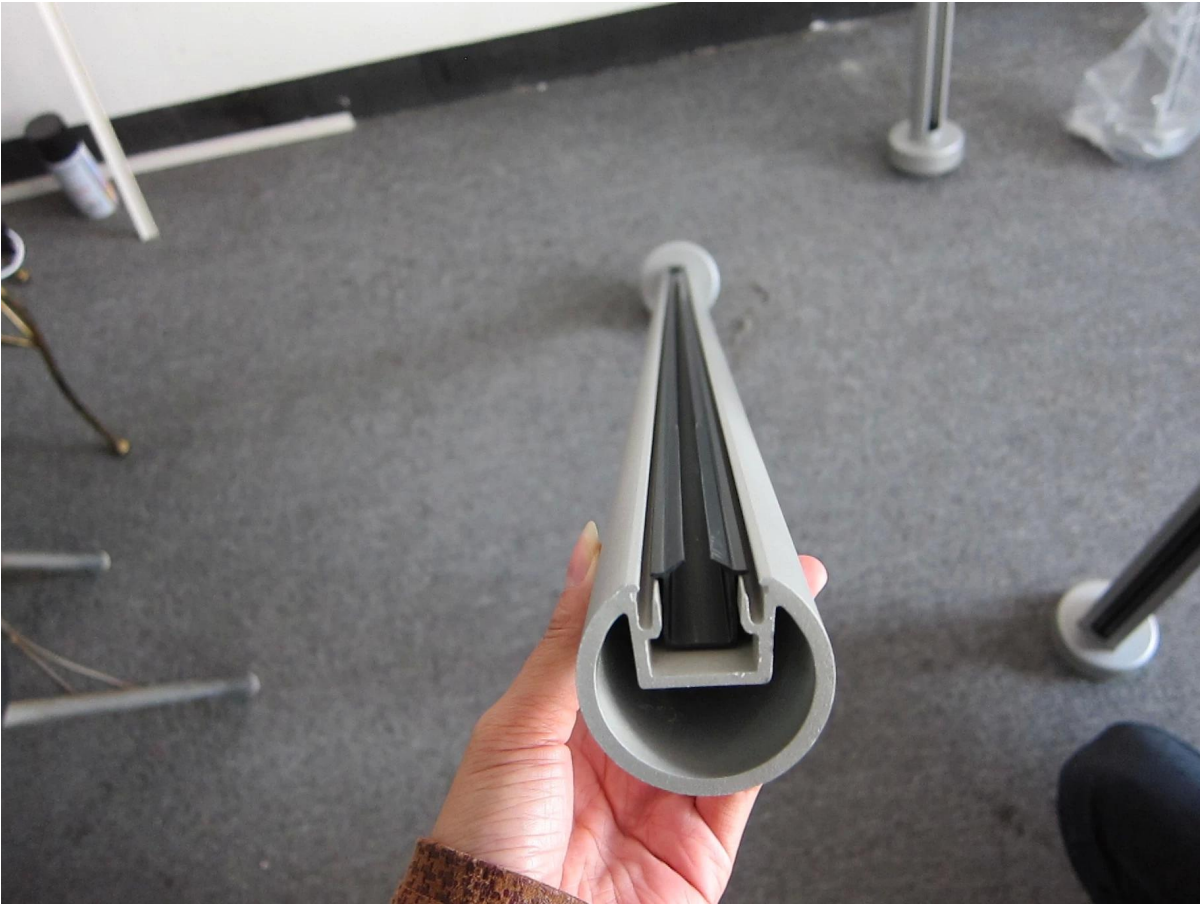
para el balcón