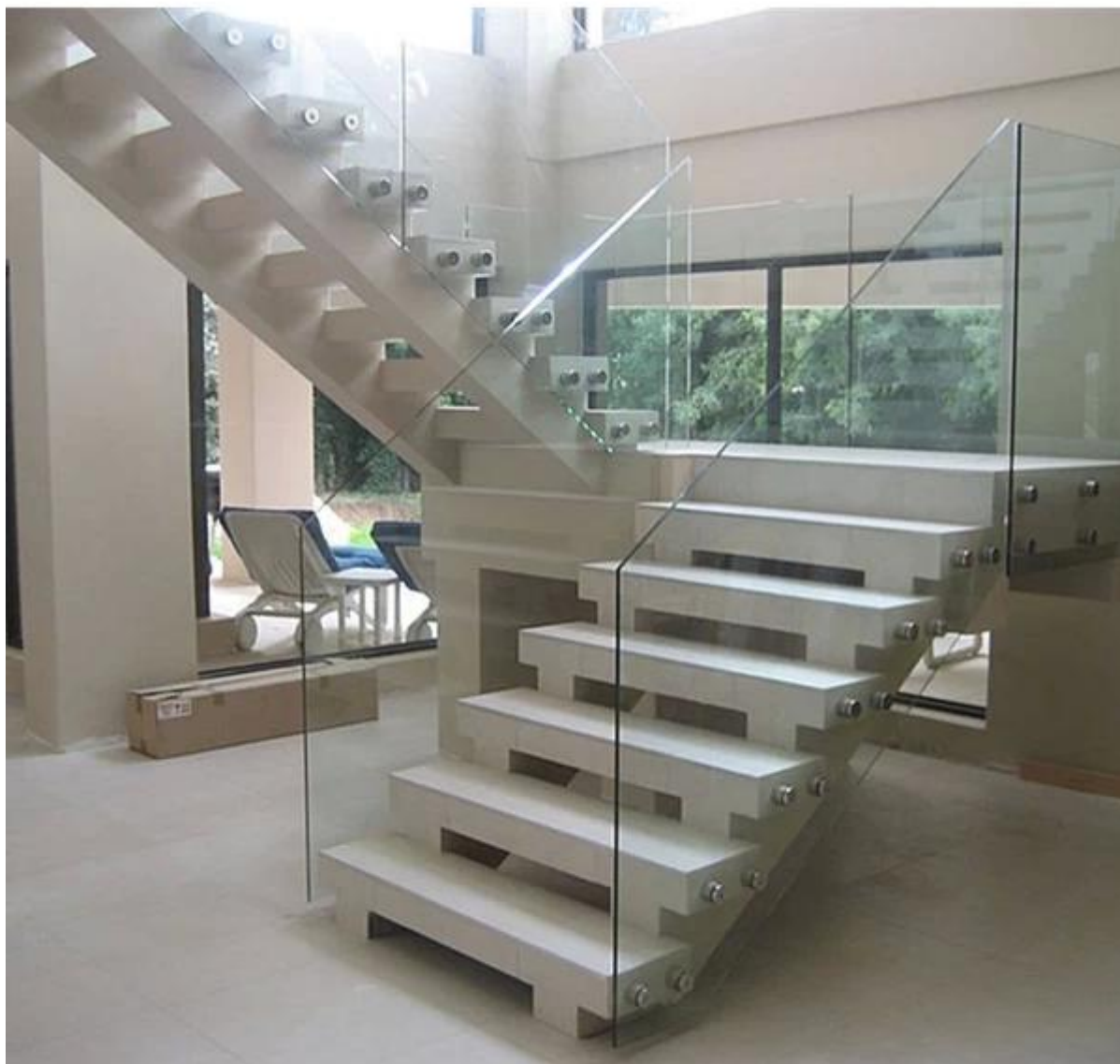
Otro diseño de enfrentamiento vidrio enfrentamiento de vidrio para las cubiertas de madera