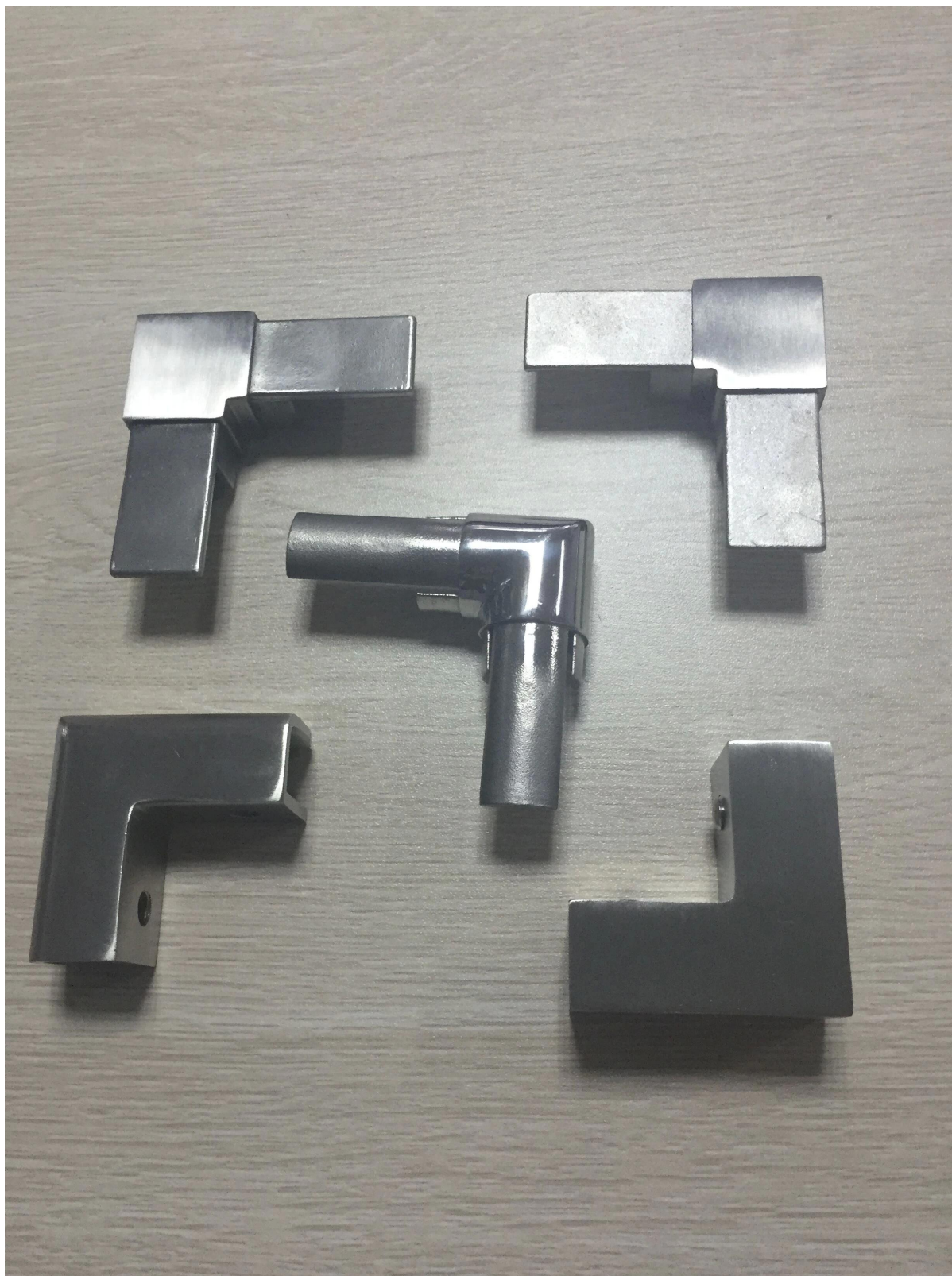
las fotos del proyecto: