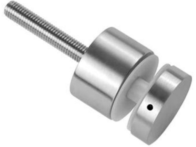
pernos de fijación de vidrio decorativo