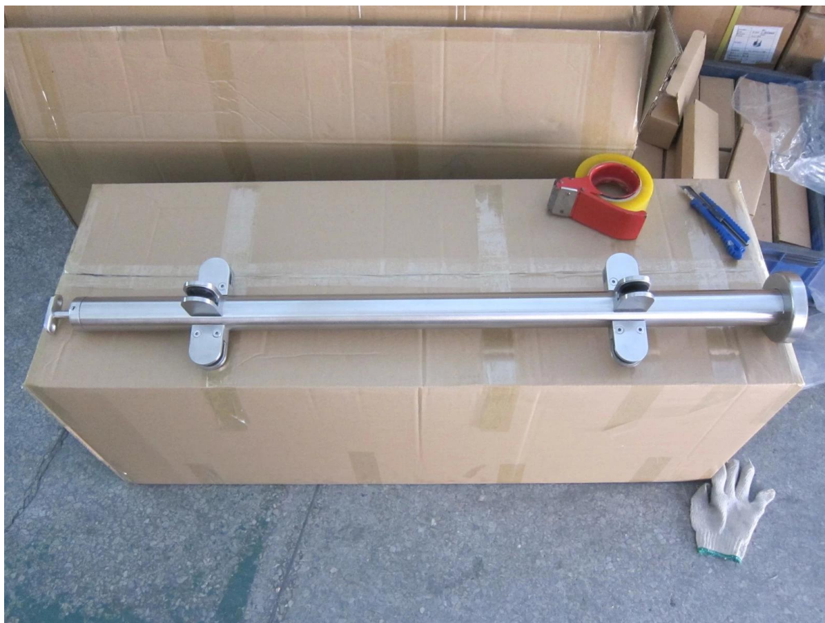
3. Foto de proyecto de balastrada de vidrio para su referencia,