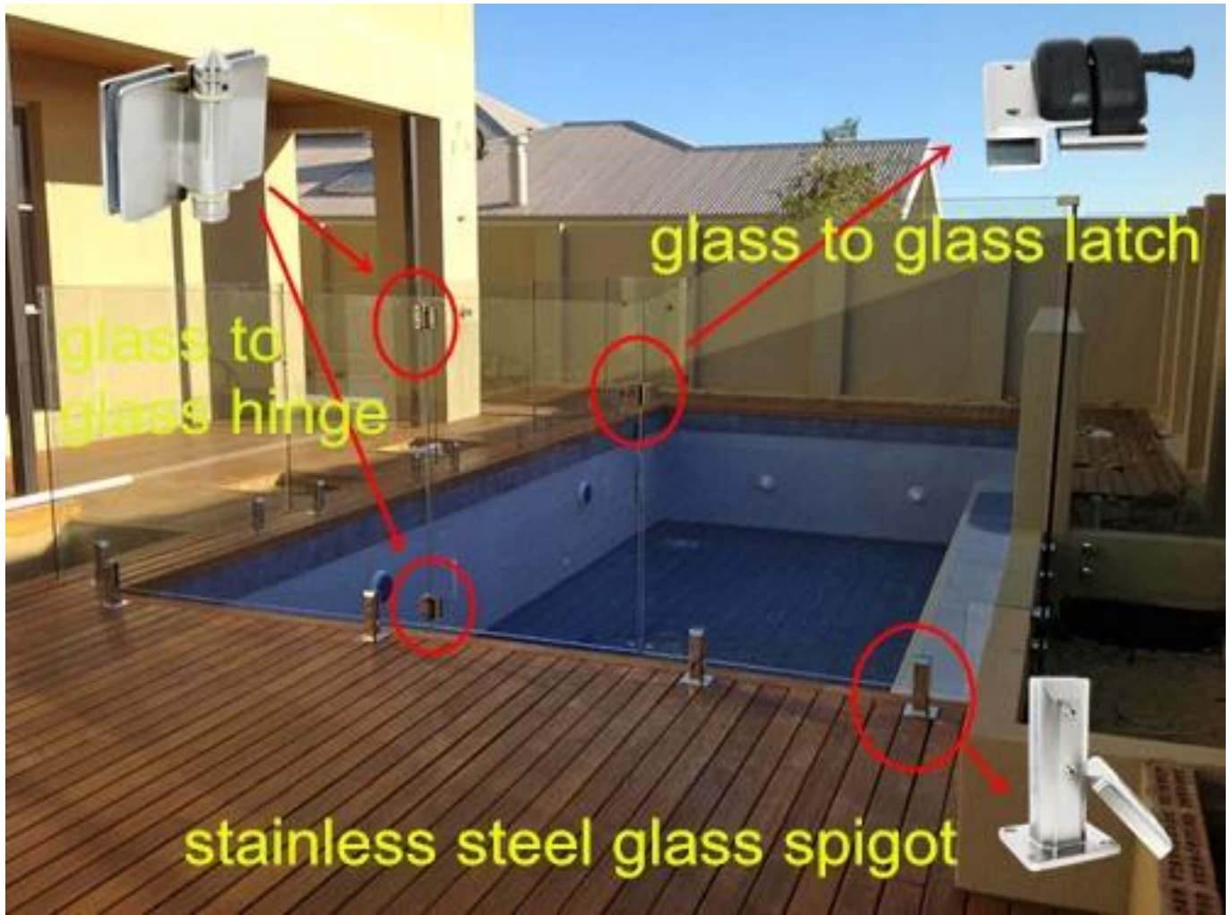
cercado de la piscina del resorte cargado de acero inoxidable 316 de vidrio dibujo posición de los orificios del panel de vidrio estándar de bisagra de la puerta,