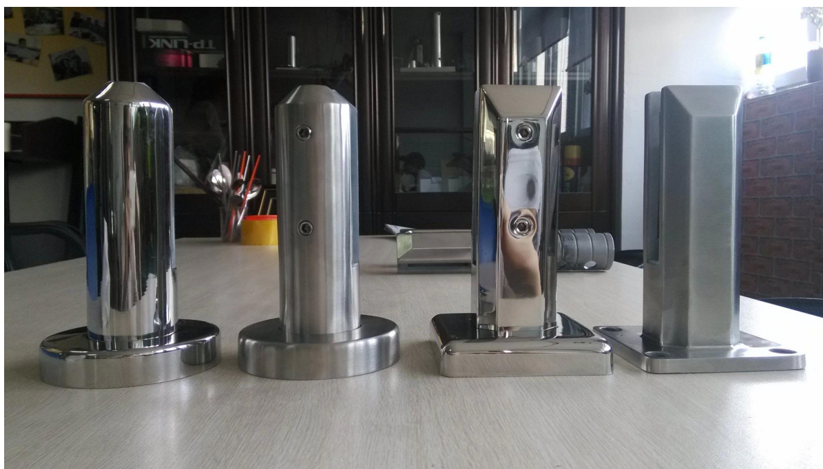
3. barandilla de vidrio sin marco marina del grado de acero inoxidable 316 de espiga las fotos del proyecto,