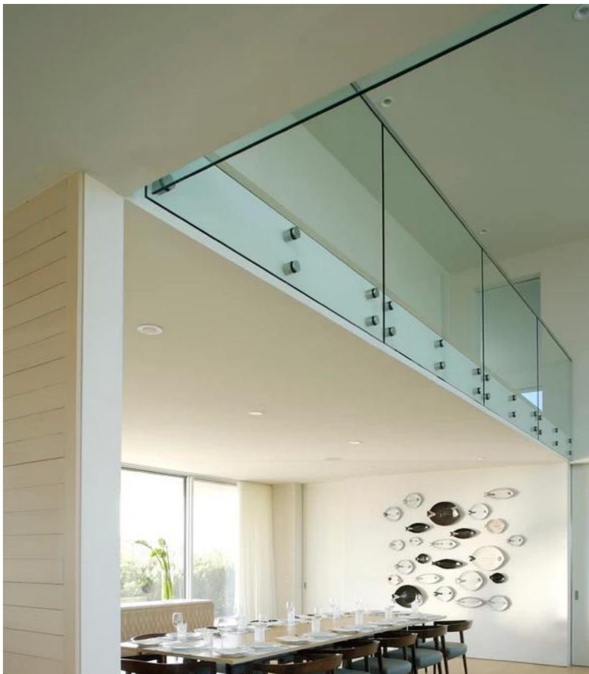
4. barandilla de vidrio enfrentamiento de vidrio Modelo No.SF-50T: javascript: void (0); / * 1469851036100 */