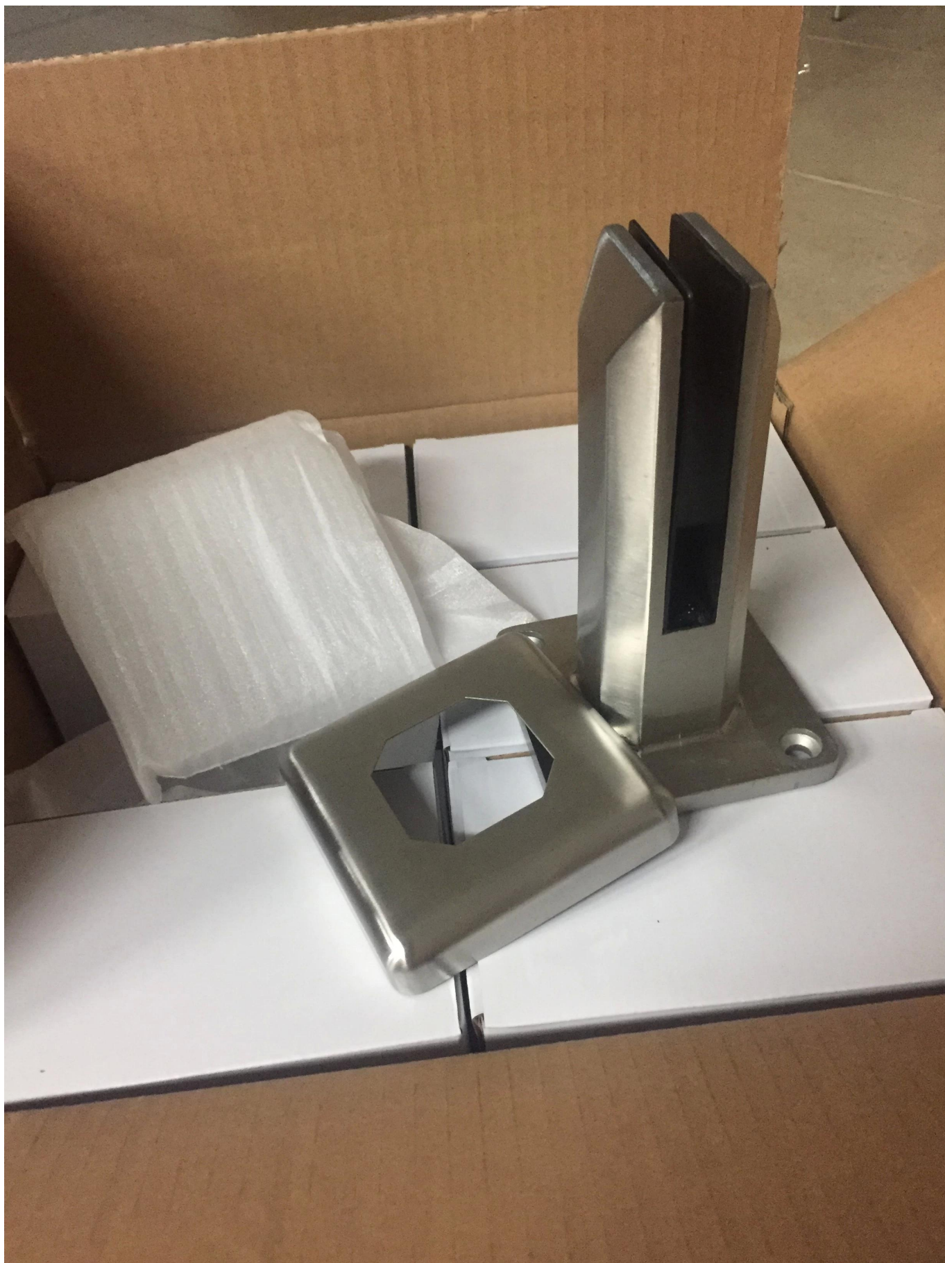
Foto de instalación sin pasamanos