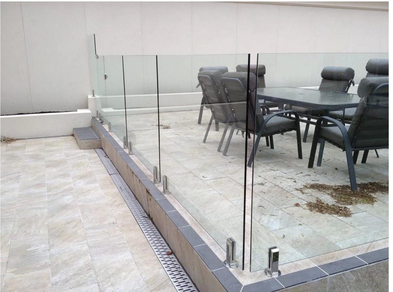
Foto de instalación con pasamanos