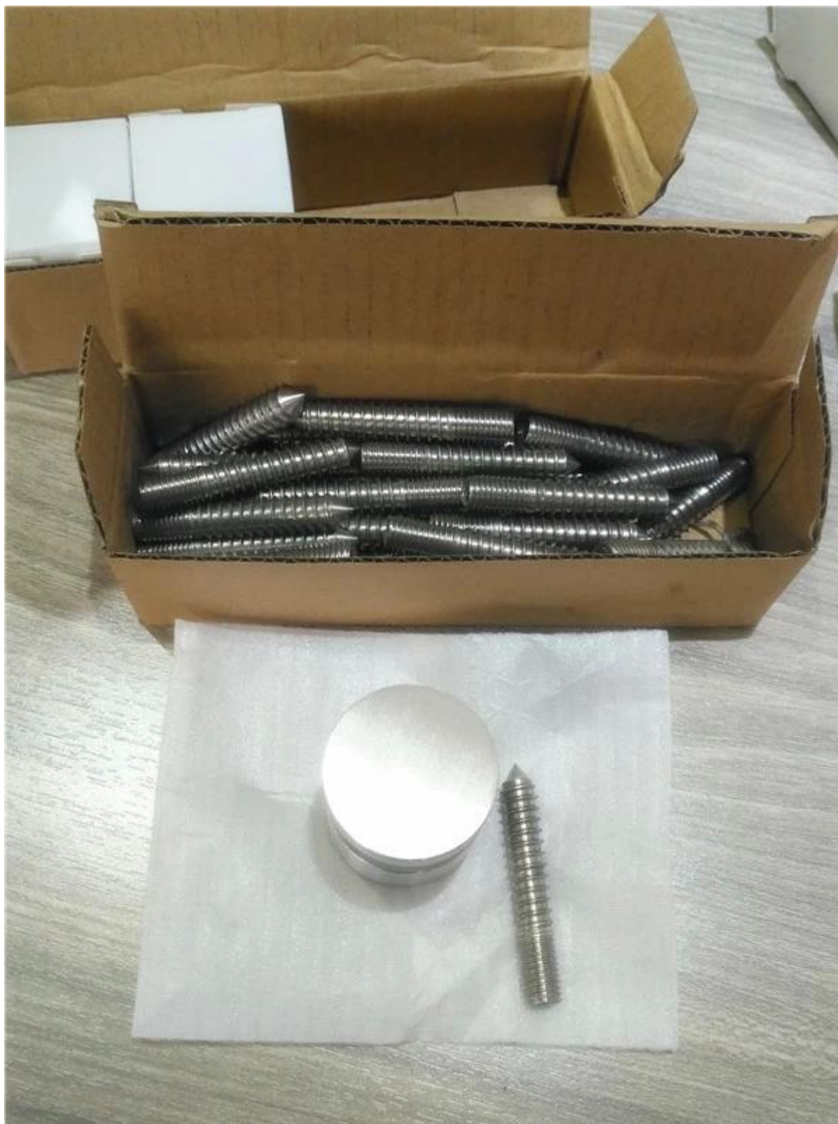
Mirror ponde uno: