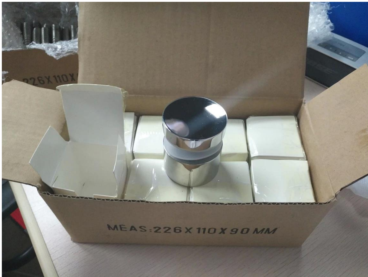
3. Separador de acero inoxidable de 2 "en proyecto de barandilla de balcón de cristal de la escalera de cristal sin marco: